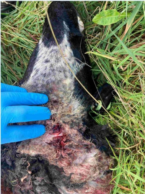
schaap 1 keelbeet.JPG