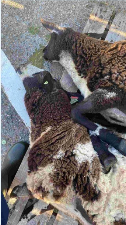
schaap 3 en 4 (geëuthanaseerd).JPG