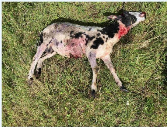
schaap 2 verwonding 1.JPG