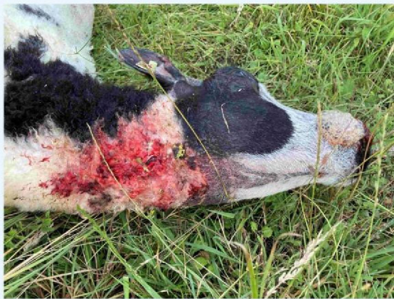
schaap 2 keelbeet.JPG