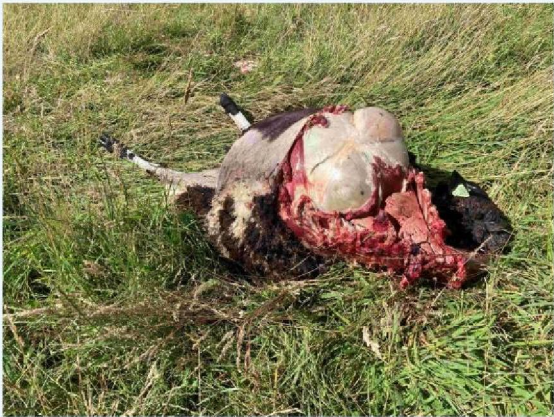
schaap 1 vraatbeeld 2.JPG