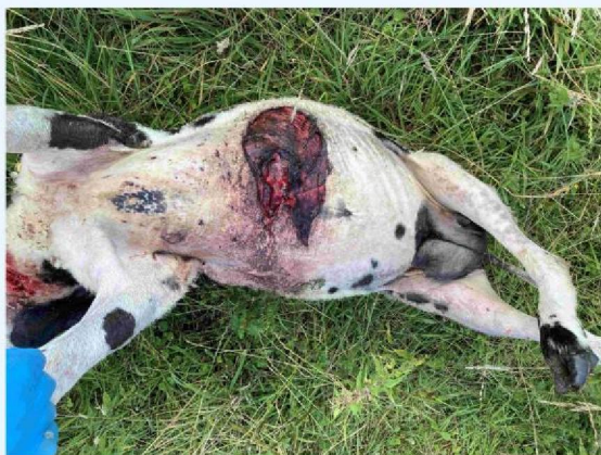
schaap 2 verwonding 2.JPG