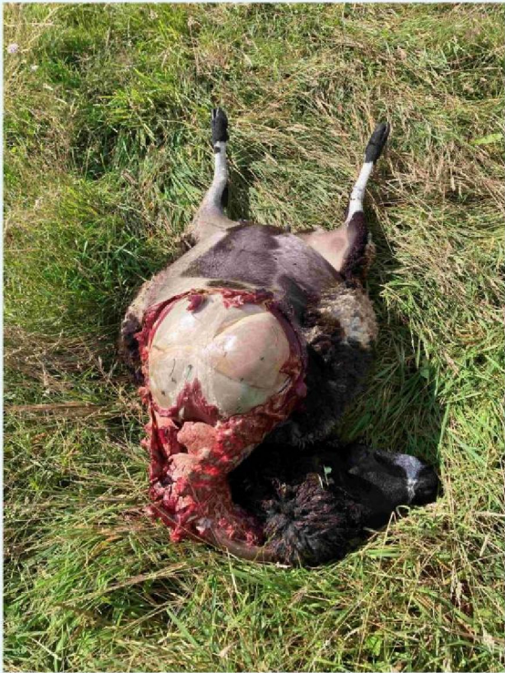
schaap 1 vraatbeeld 1.JPG