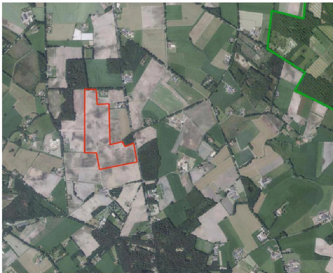
Afbeelding 4. Globale ligging onderzoeksgebied (rood kader) ten opzichte van het Natura 2000 gebied.

Door het veranderen van de beleidsvoering m.b.t. tot het landelijk stikstof probleem wordt voor alle ruimtelijke ontwikkelingen gebruikt gemaakt van de beslisboom. Voor alle "nieuwe" ontwikkelingen moet een AERIUS-berekening worden uitgevoerd. Uit de AERIUS-berekening zal blijken of met de voorgenomen ontwikkeling de stikstof depositie toeneemt. Als de uitkomst hiervan 0,00 of minder is kan een vergunning worden verleend.