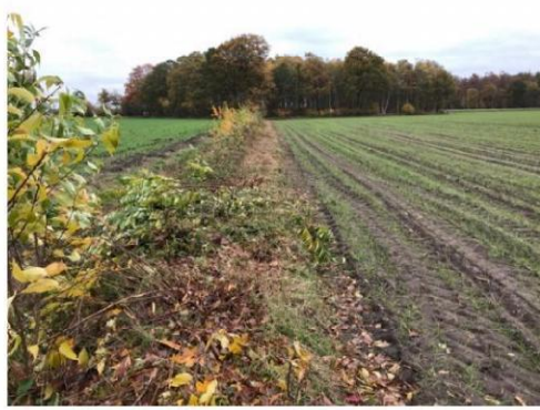
4. Loofhoutbosje grenzend aan planlocatie