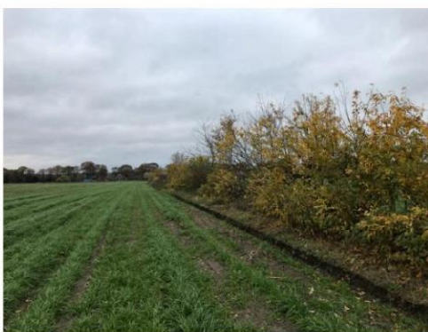
2. Oud restant van een houtwal