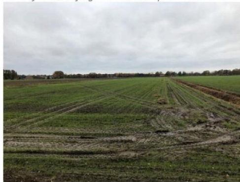
6. Agrarische percelen