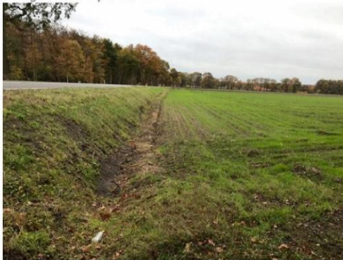
5. Ruurloseweg met lager gelegen plangebied