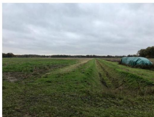
1. Planlocatie gezien vanaf Doktersdijk