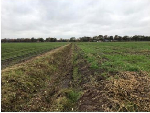
3. Agrarische percelen