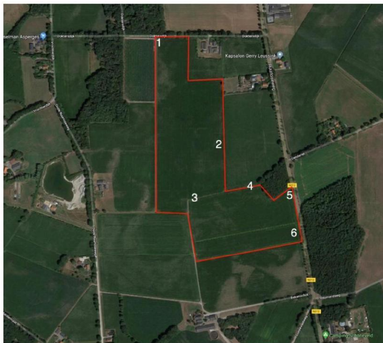
Afbeelding 3: Kaart planlocatie