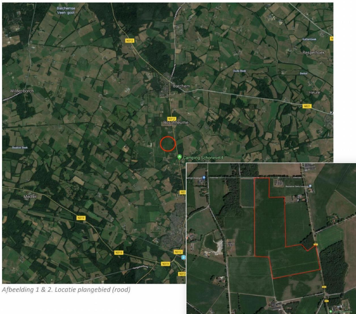
Afbeelding 1 & 2. Locatie plangebied (rood)

De onderzoekslocatie betreft een agrarisch perceel waarop restanten te vinden zijn van maïsteelt. Langs de randen aan de oostzijde zijn restanten van een houtwal aanwezig. Op de onderstaande afbeelding wordt de planlocatie met een rode kleur weergegeven.