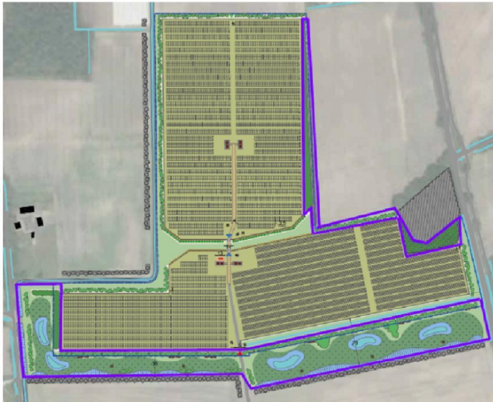
Figuur 5: Landschapselementen die behouden blijven (paars omlijnd)