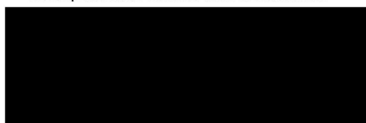
plv. Commissaris van de Koning

Hoogachtend, Gedeputeerde Staten van Gelderland