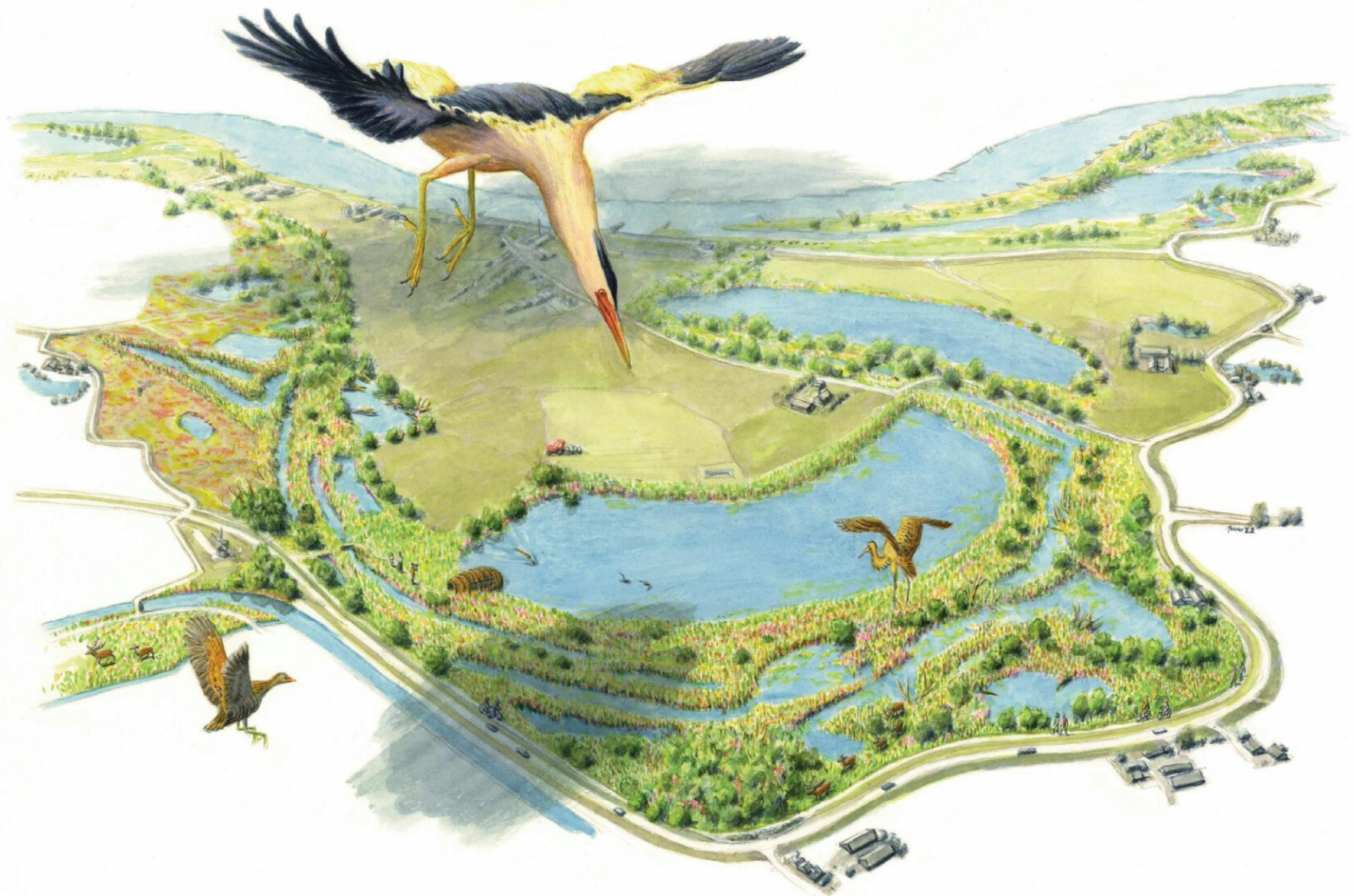
Sfeerimpressie Ooijse Graaf