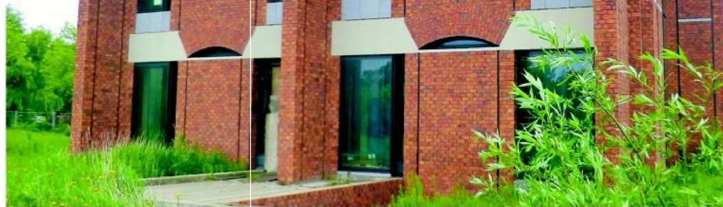
Het stoere gebouw zoals Noord-Hollanders dat kennen. Groot, megalomaan, ambitieus en inspirerend. Maar al vijf jaar leeg en werkloos en daarmee symbool voor de neergang van de DSB-bank van Dirk Scheringa.

Op tafel ligt de kleurrijke folder die hun gedachtegoed illustreert. Dekker wijst op het blokje 'Agri & Gezondheid'. „Weet je hoeveel winst er op het gebied van voedsel-technologie te behalen valt? Dat gaat om miljarden. Minister Edith Schippers kan grote bedragen op de gezondheidszorg en de zorg