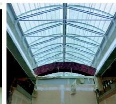
Transparante daken voor een optimale lichtinval.

Agri-faculteit via lijn Universiteit in Wageningen