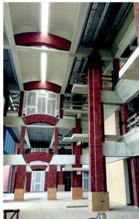
Imposante vertrekruimte die om nieuwe invulling vraagt.