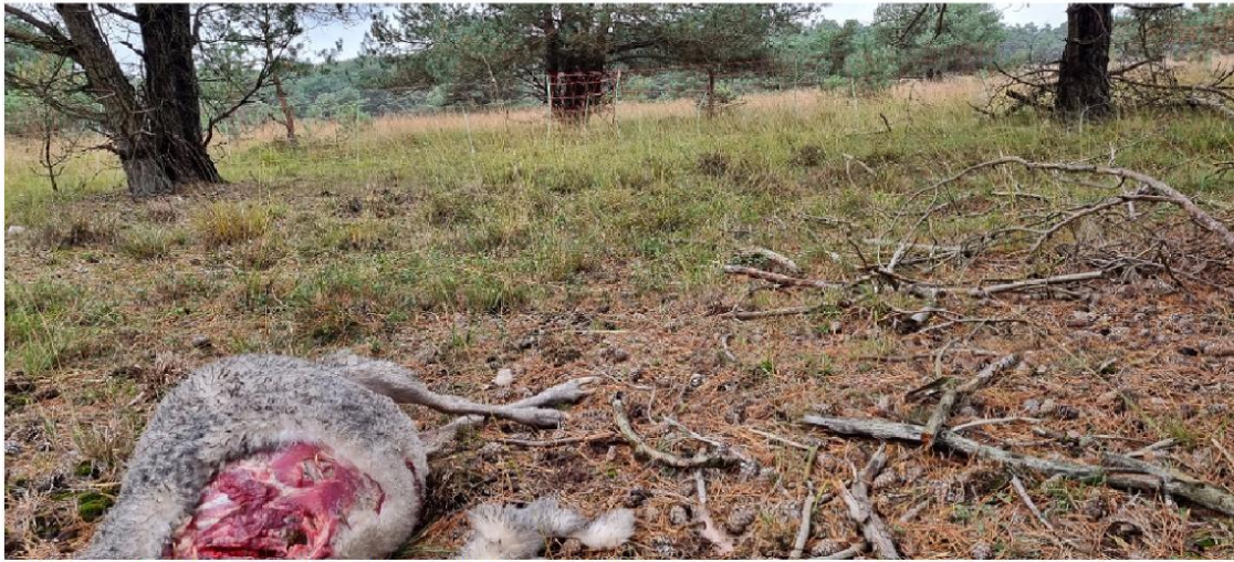
Schaap onder de grove den, alleen linker voorpoot /ribben aangevreten