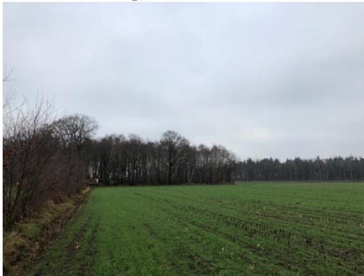
Noordoostzijde planlocatie, nummer 4