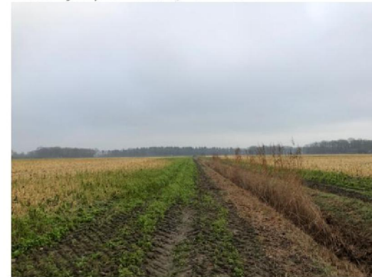
Zuidwestzijde planlocatie, nummer 6