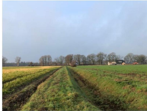
Overzicht planlocatie, nummer 2