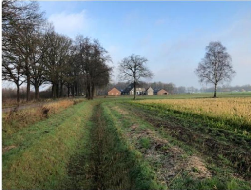
Oude Ruurloseweg, nummer 1