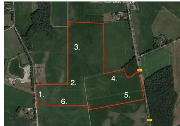
Figuur 1&2. Locatie plangebied (rood) (Pdok, z.d.)