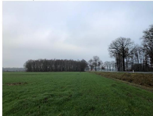
Zuidoostzijde planlocatie, nummer 6