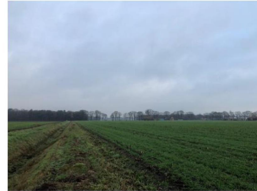
Noordzijde planlocatie, nummer 3