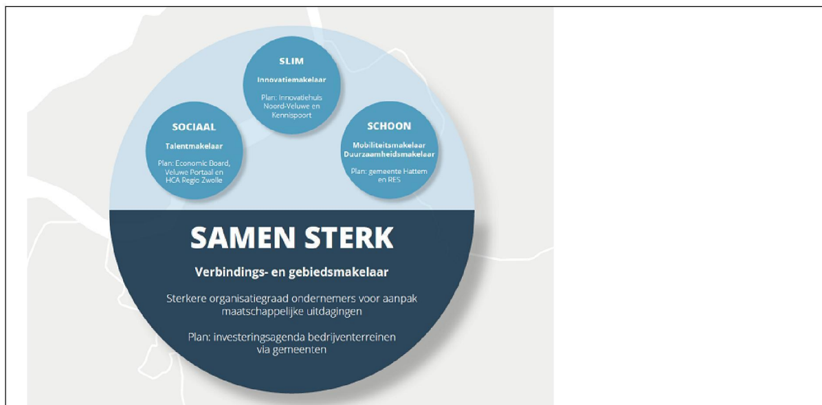
Figuur: Ondersteuning + 'bundeling inzet overheid' gericht op bedrijventerrein

Op de Noord-Veluwe en ook voor De Kolk en Feithenhof zijn voor de ambities Slim/innovatie en Schoon/mobiliteit al makelaars aan de slag. De plannen voor Sociaal/talentmakelaar zijn in een vergevorderd stadium.