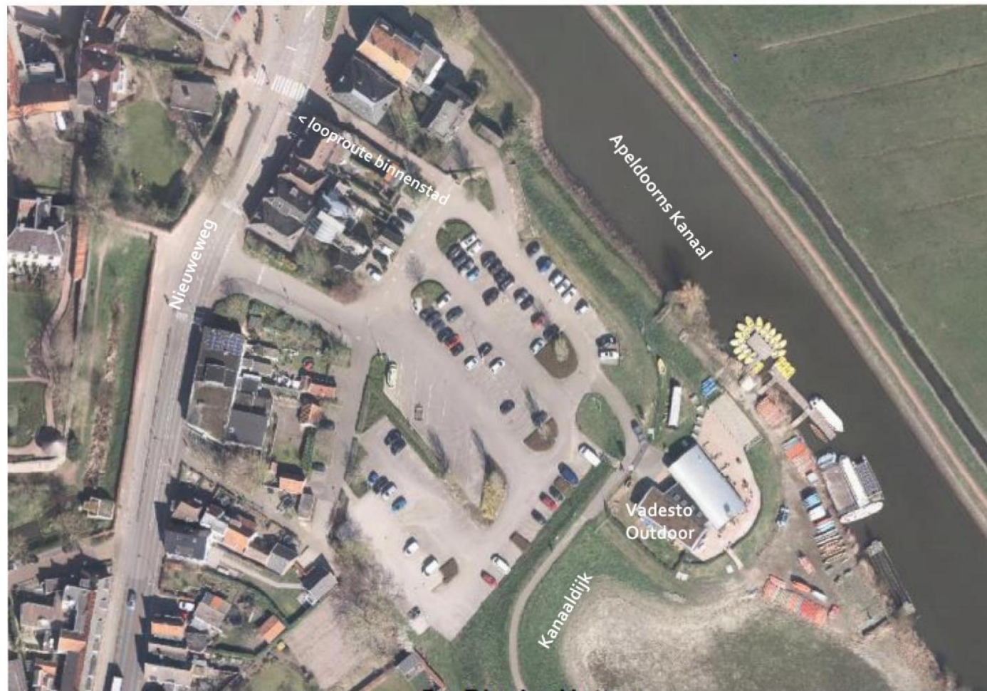
De Bleek - Hattem