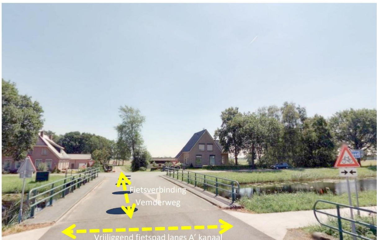
Aansluiting op het vrijliggend fietspad 'Jaagpad' langs het Apeldoorns Kanaal