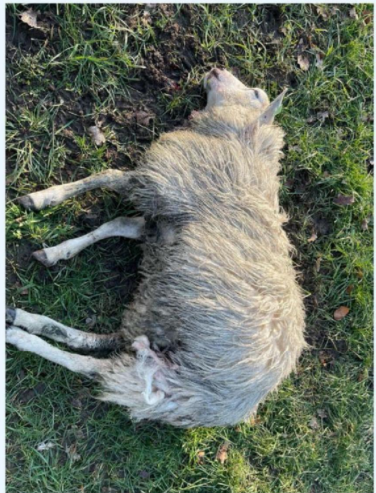
IMG-20250203 -WA0002 .jpg