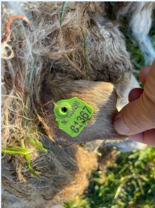
IMG-20250203 -WA0001 .jpg