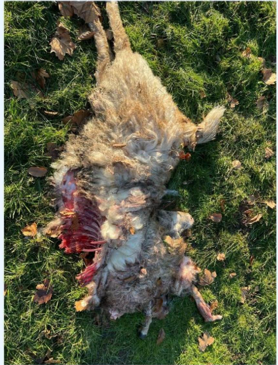
IMG-20250203 -WA0000 .jpg