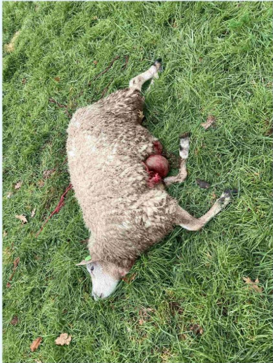
schaap 3 vraatbeeld 1.JPG