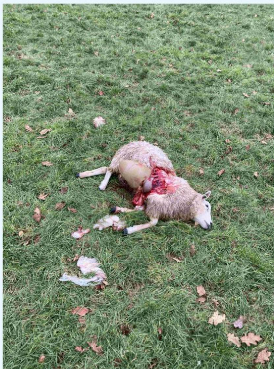
schaap 1 vraatbeeld.JPG