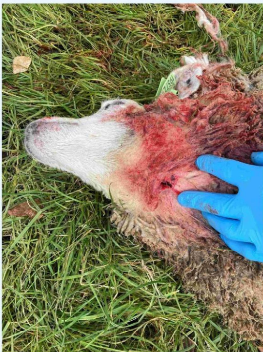
schaap 1 keelbeet.JPG