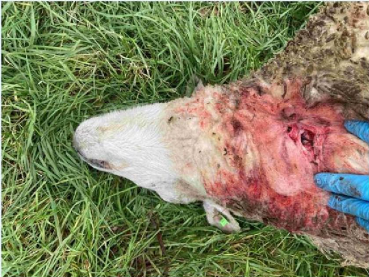
schaap 3 keelbeet.JPG