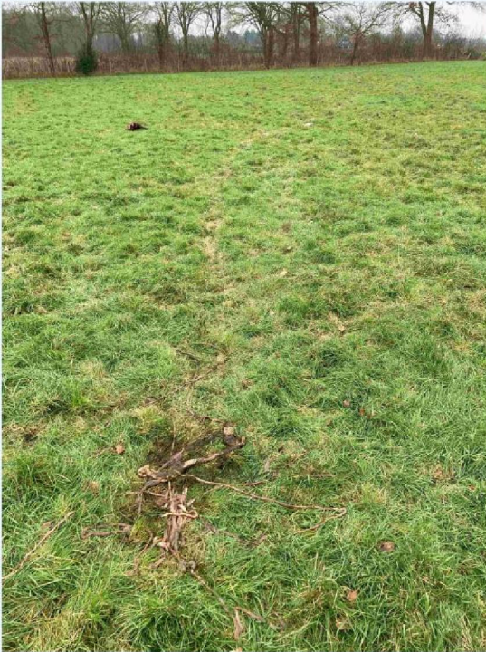
schaap 2 ingewanden (darmen) en sleepspoor.JPG