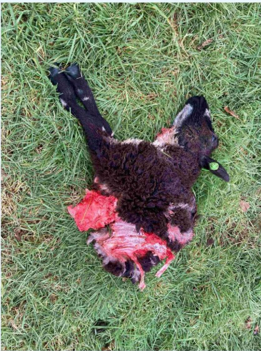
schaap 2 vraatbeeld 1.JPG