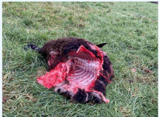
schaap 2 vraatbeeld 2.JPG