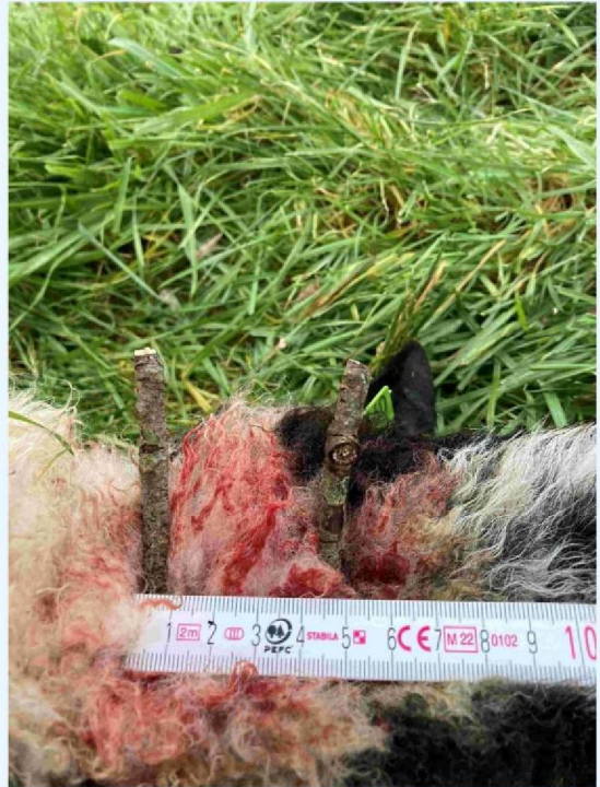
schaap 2 keelbeet.JPG