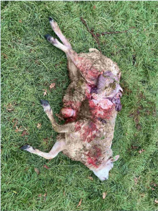
schaap 3 vraatbeeld 2.JPG