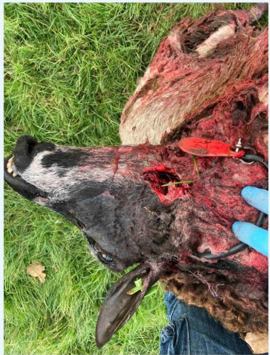
schaap 2 keelbeet.JPG