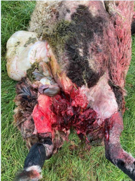
schaap 2 vraatbeeld 1.JPG