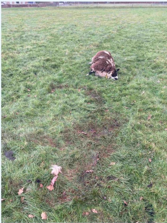
schaap 3 sleepspoor.JPG