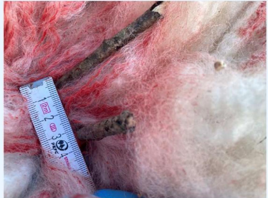
schaap 1 keelbeet 4 cm.JPG