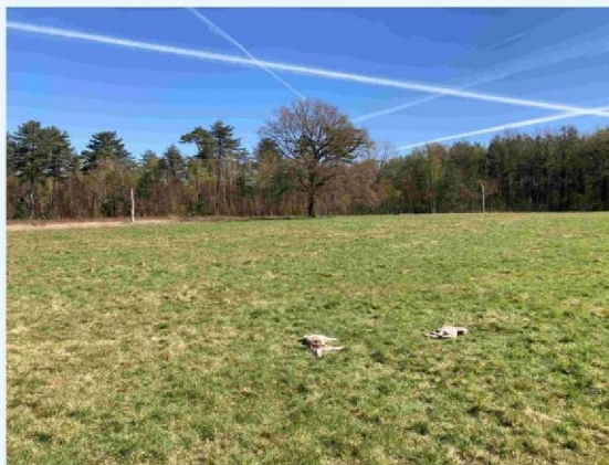
overzicht lammeren en weiland.JPG