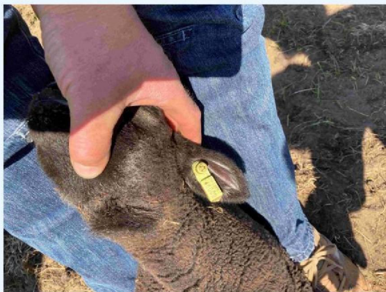
lam 3 gewond.JPG