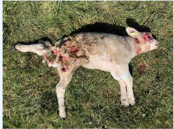
lam 1 vraatbeeld.JPG