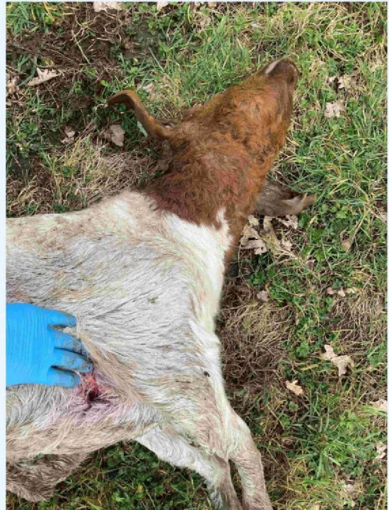
geit 1 bijtmond borstkas.JPG