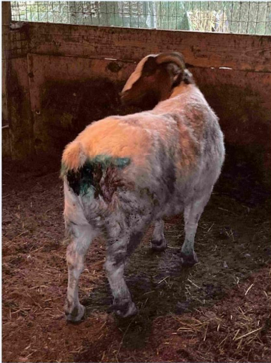
geit 2 met wond.JPG