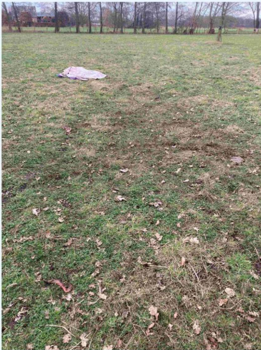
overzicht en sleepspoor.JPG