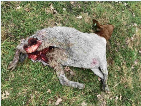
geit 1 vraatbeeld 1.JPG