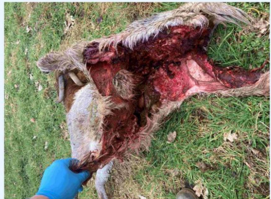
geit 1 vraatbeeld 2.JPG