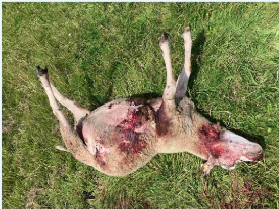
schaap 2 verwondingen.JPG