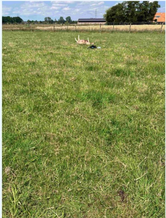
schaap 1 sleepspoor.JPG