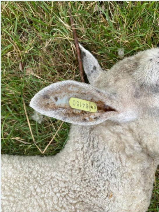
schaap 4 oornummer.JPG