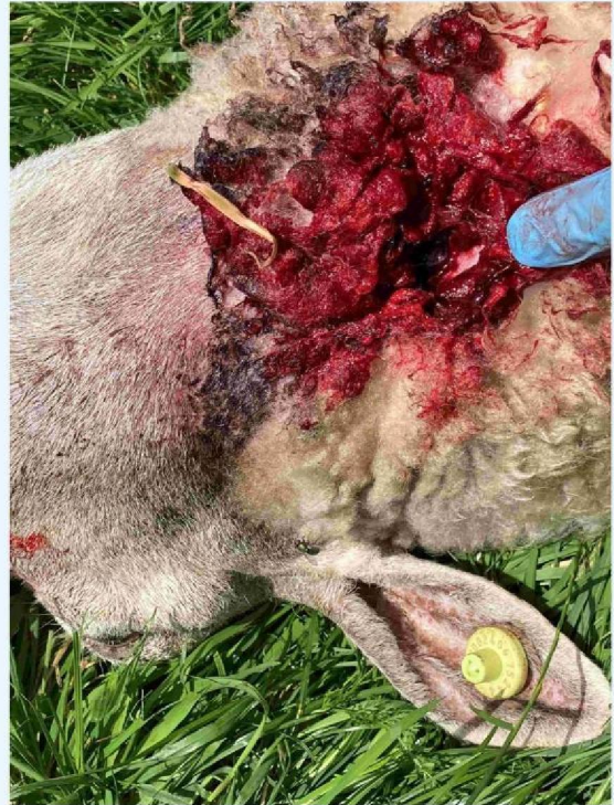
schaap 2 keelbeet.JPG