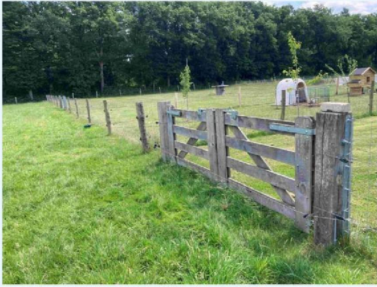
hekken niet wolfwerend.JPG