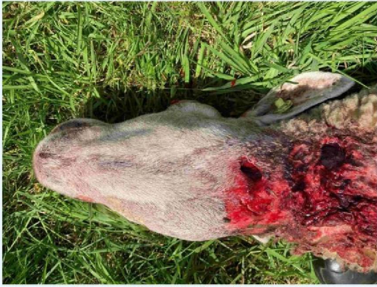
schaap 3 keelbeet.JPG