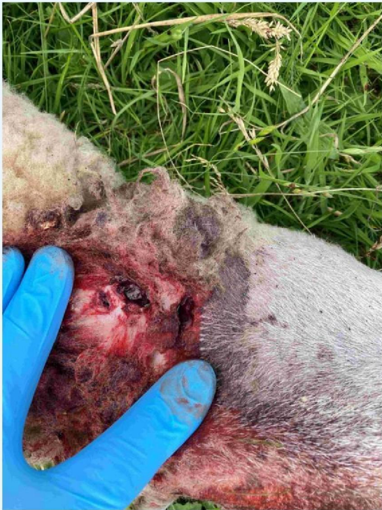
schaap 1 keelbeet.JPG