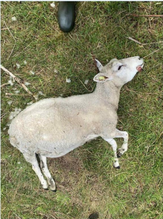
schaap 4 dood gegaan op 27-6.JPG