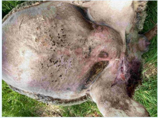
schaap 3 verwonding.JPG