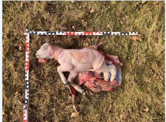
lam bijna voldragen.JPG