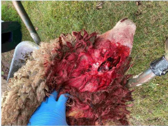
schaap 1 keelbeet.JPG