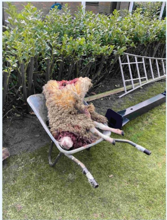
schaap 1 in kruiwagen.JPG