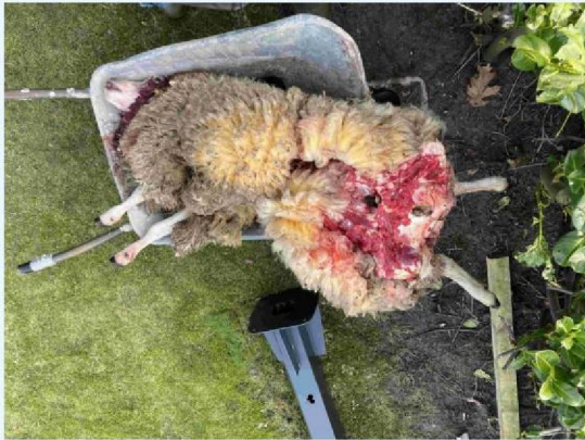
schaap 1 vraatbeeld 1.JPG