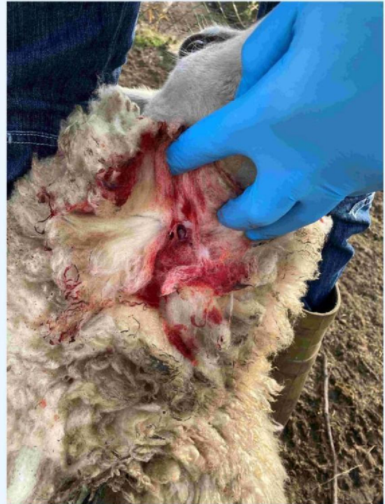
schaap 2 gewond - keelbeet.JPG