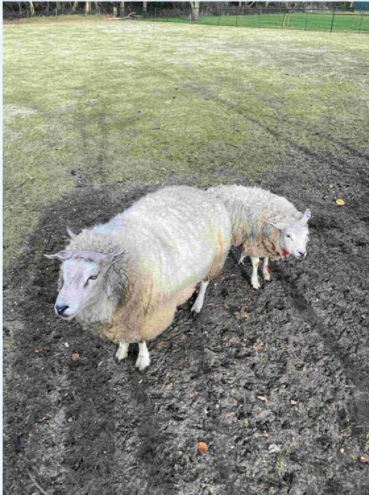
schaap 2 (rechts) met keelbeet.JPG