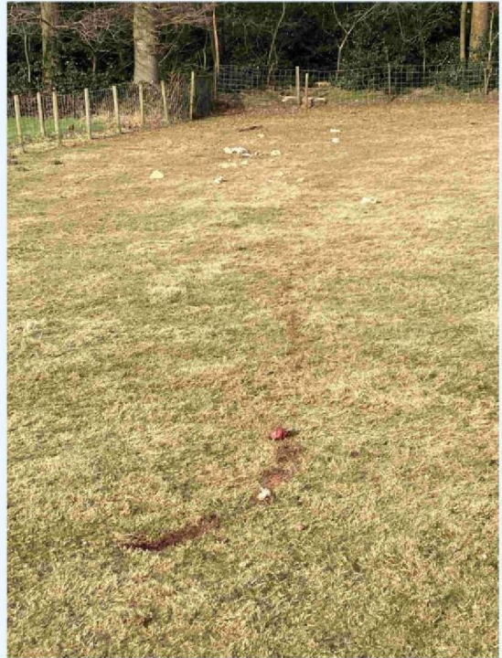
schaap 1 sleepspoor.JPG