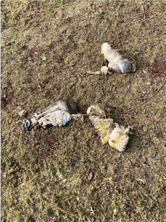
ingewanden en vliezen met ongebooren lam.JPG