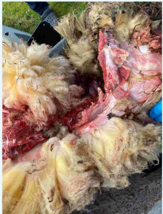
schaap 1 vraatbeeld 2.JPG