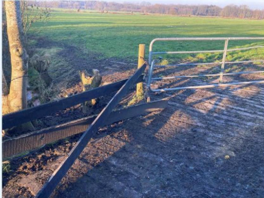
afrastering kapot door aanval.JPG