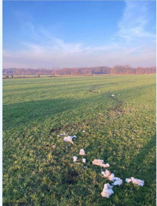
schaap 2 omgeving en sleepspoor.JPG