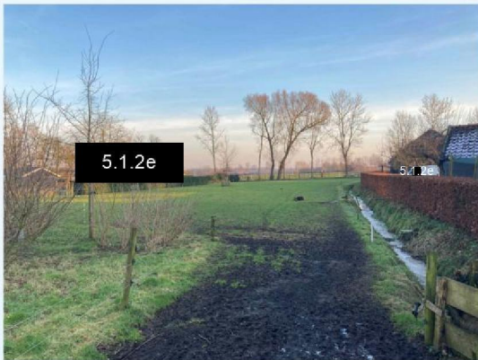
schaap 1 omgeving.JPG