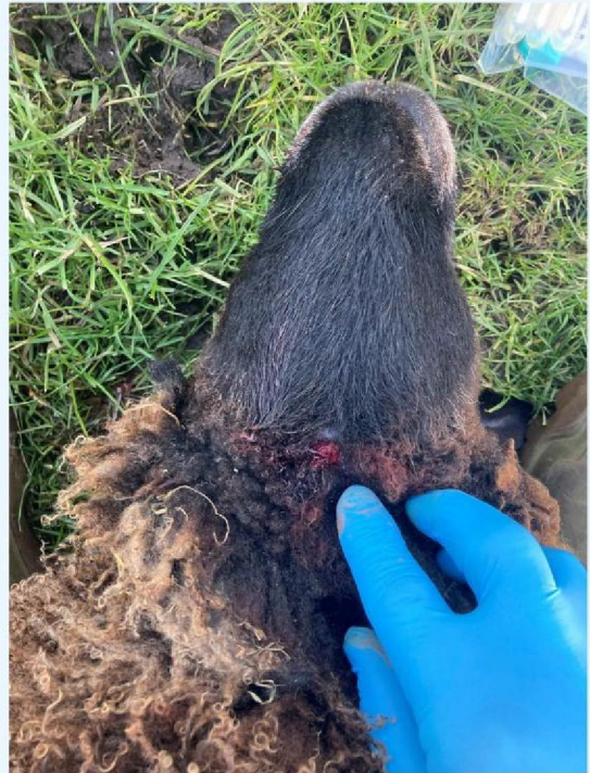
schaap 1 keelbeet.JPG