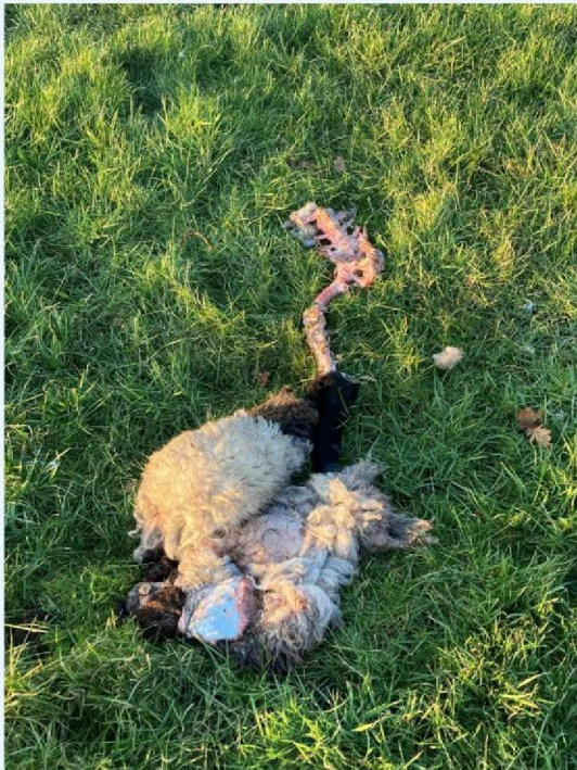
schaap 2 poot en huid.JPG