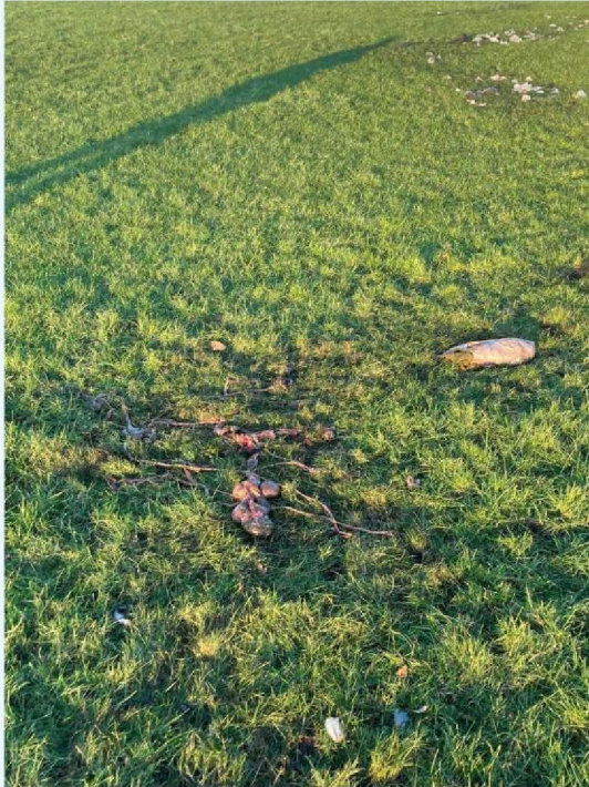
schaap 2 ingewanden.JPG