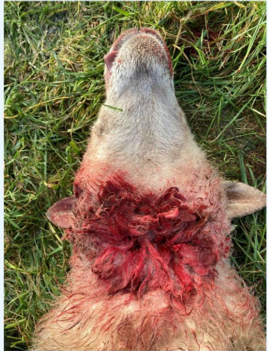
keelbeet schaap 2.JPG