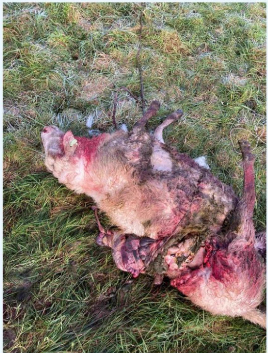
vraat schaap 1 andere zijde.JPG