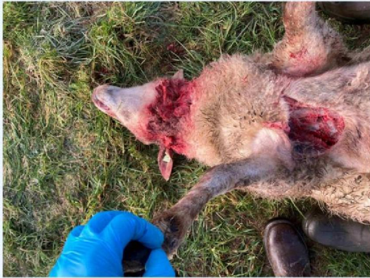
wond schaap 2.JPG