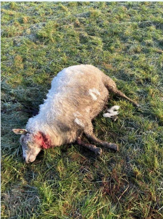
keelbeet schaap 1.JPG