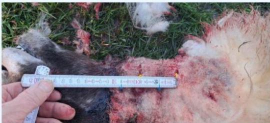
Keelbeet 6 cm.jpg