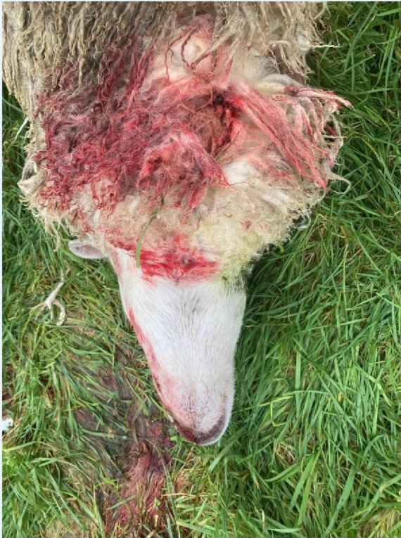
keelbeet 2e schaap.JPG