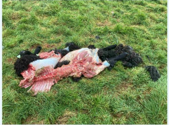
vraatbeeld schaap 1.JPG