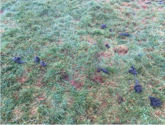
start aanval schaap 1.JPG