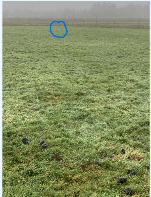
sleepspoor schaap 1 met cirkel.JPG