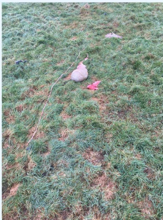
ingewanden schaap 1.JPG