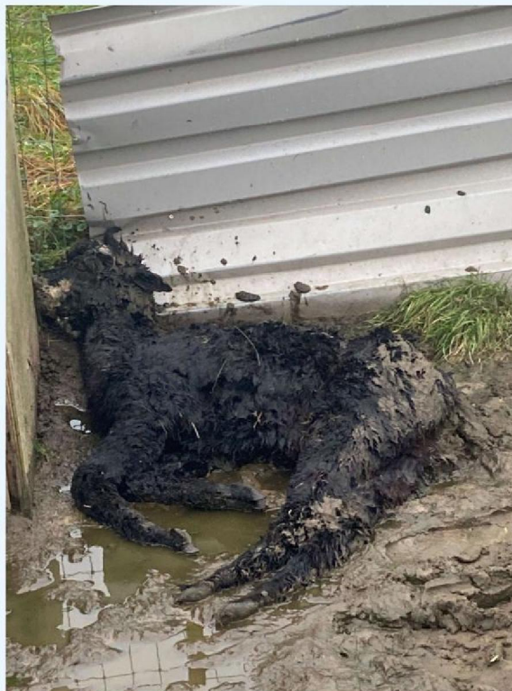
alpaca foto 1.JPG