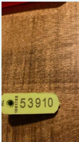
Oornummer later dood gegaan dier.jpg