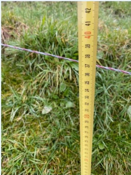
Hoogte draad 1.jpg