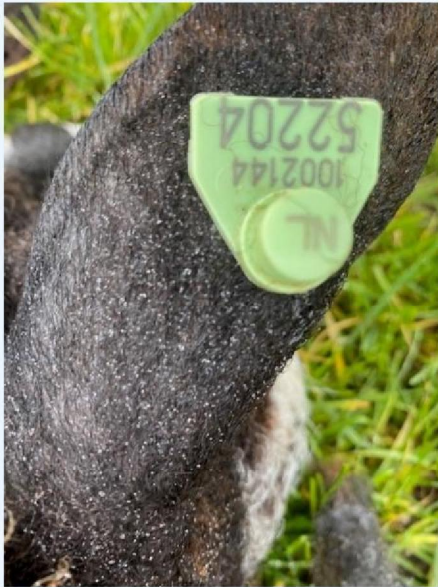
Oornummer schaap 3.jpg