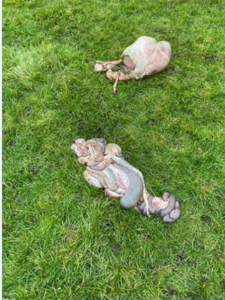
Pens en ingewanden schaap 2.jpg