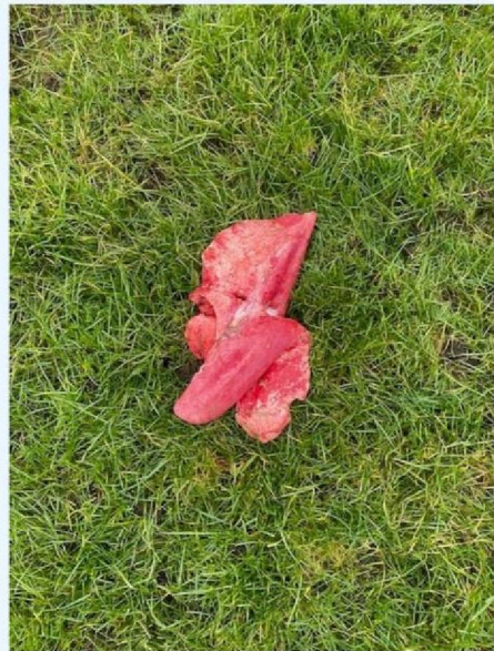
Long schaap 2.jpg