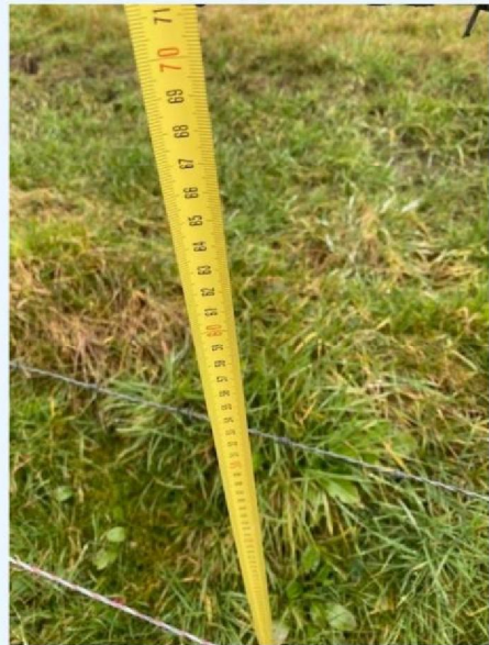
Hoogte draad 2.jpg