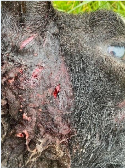
Wonden op de kop schaap 4.jpg