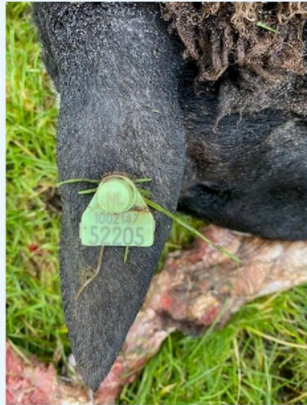
Oornummer schaap 2.jpg