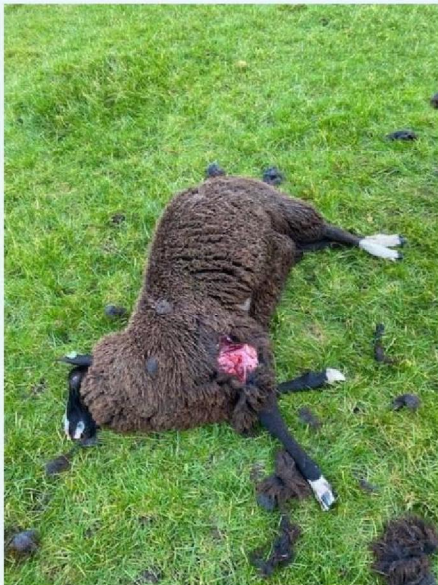
Schaap 3 overzicht.jpg