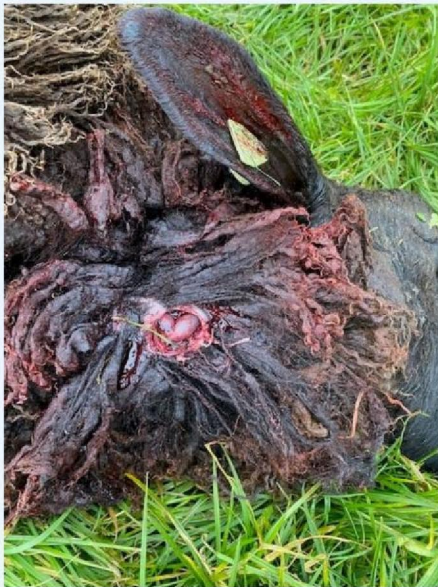
Wond in de nek schaap 1.jpg