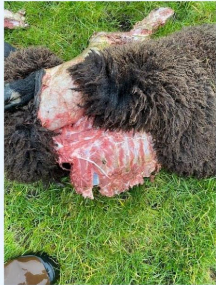
Borstkas schaap 2.jpg