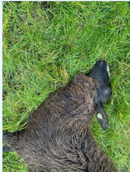
Keelbeet schaap 1.jpg