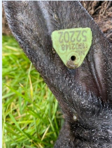
Oornummer schaap 1.jpg