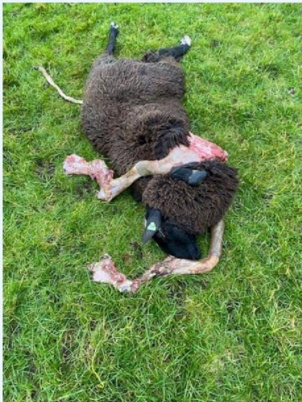
Overzicht schaap 2.jpg