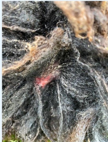
Keelbeet schaap 4.jpg