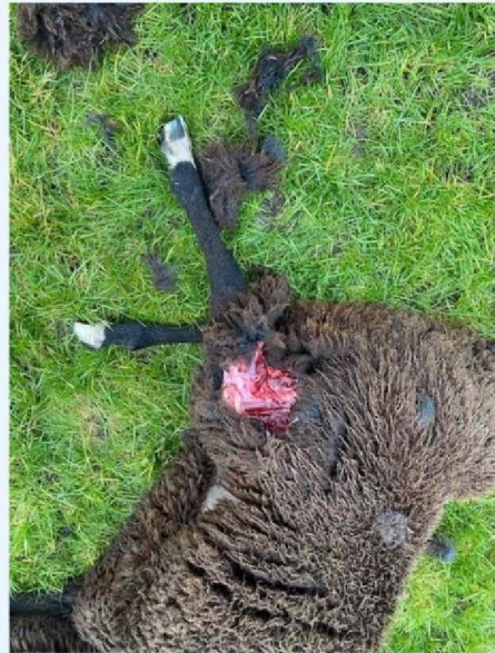
Wond schaap 3.jpg