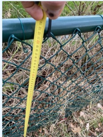
Hoogte gazen omheining.jpg