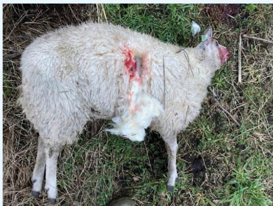
schaap 1 wond zijkant.JPG