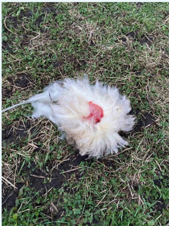
schaap 2 afgerukte huid.JPG