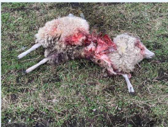
schaap 2 vraatbeeld 2.JPG