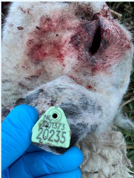
schaap 1 verwondingen kop.JPG