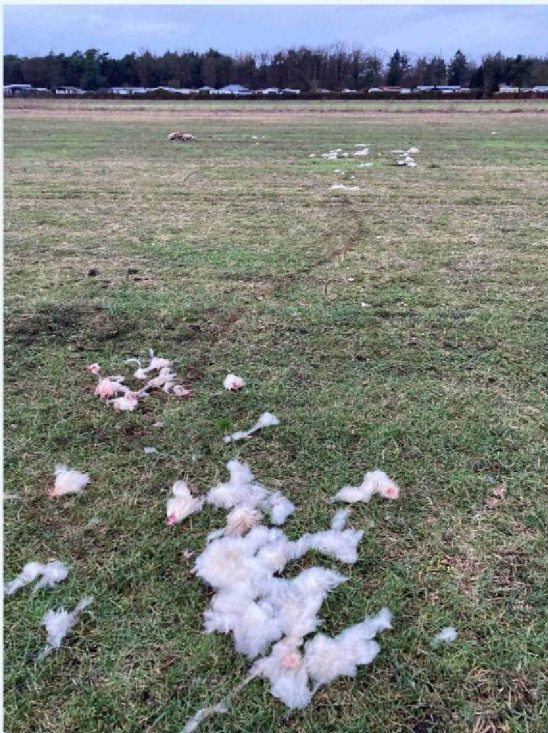
schaap 2 sleepspoor.JPG