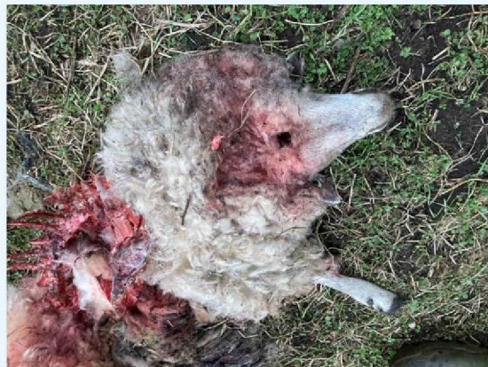
schaap 2 vraatbeeld 1.JPG