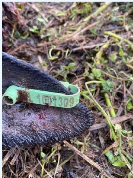
Oornummer schaap 1 eerste deel.jpg