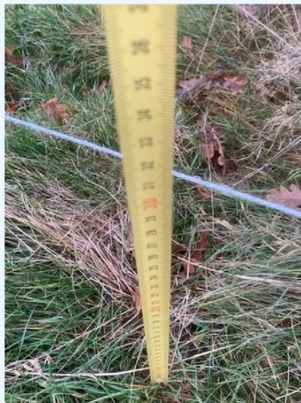
Hoogte draad 1.jpg