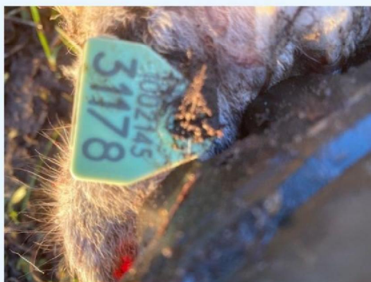
Oornummer schaap 2.jpg