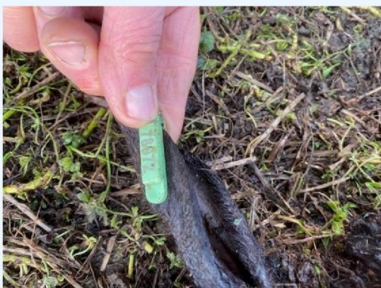
Oornummer schaap 1 tweede deel.jpg