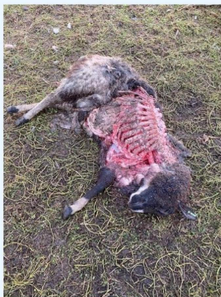
Schaap 1 andere zijde.jpg