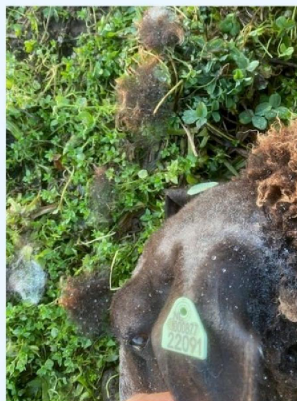
Oornummer schaap 3.jpg