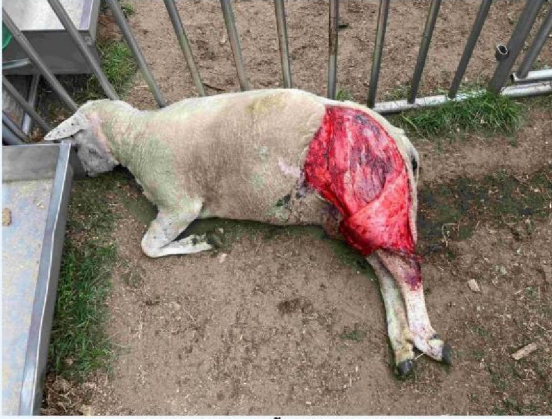
ooi gewond en geëuthanaseerd.JPG