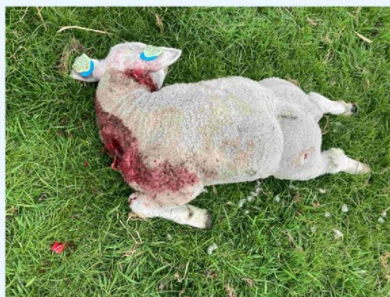
lam wond hals.JPG