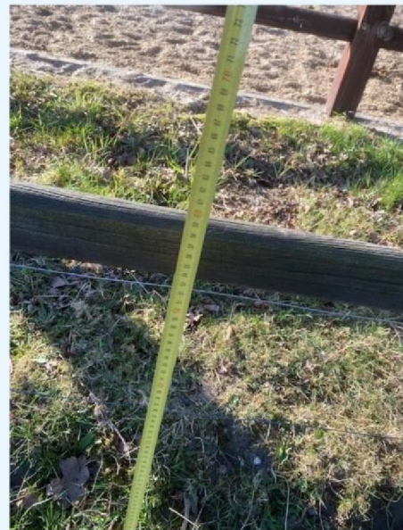
Hoogte draad beneden.jpg