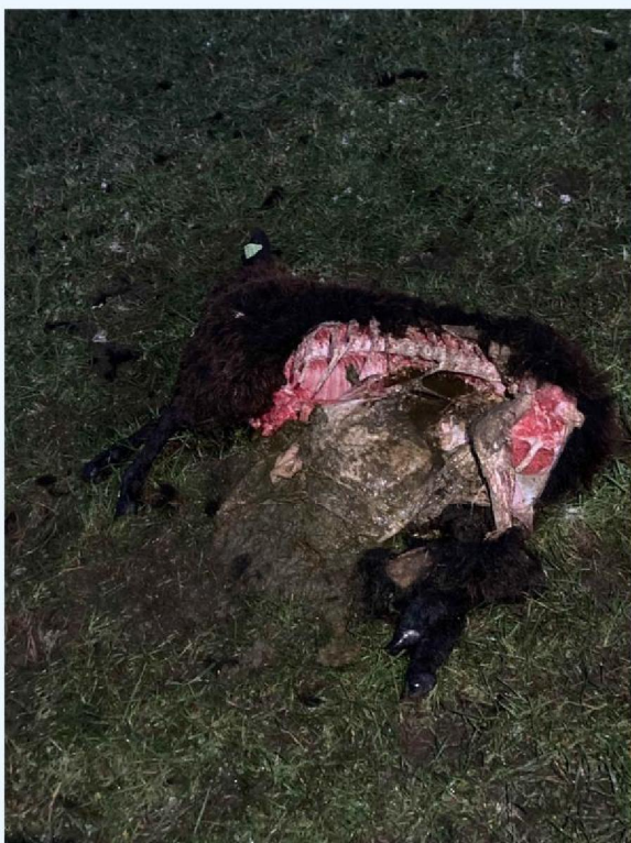
vraatbeeld schaap 1.JPG