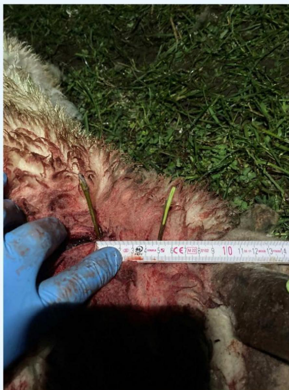
keelbeet 3 schaap 2.JPG