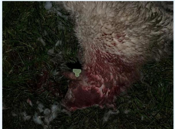
keelbeet schaap 3.JPG