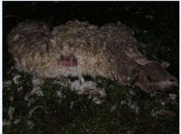
rugwond schaap 2.JPG