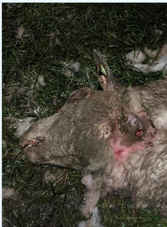
keelbeet 1 schaap 2.JPG