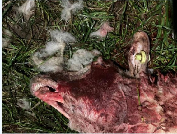
neusbeet schaap 3.JPG