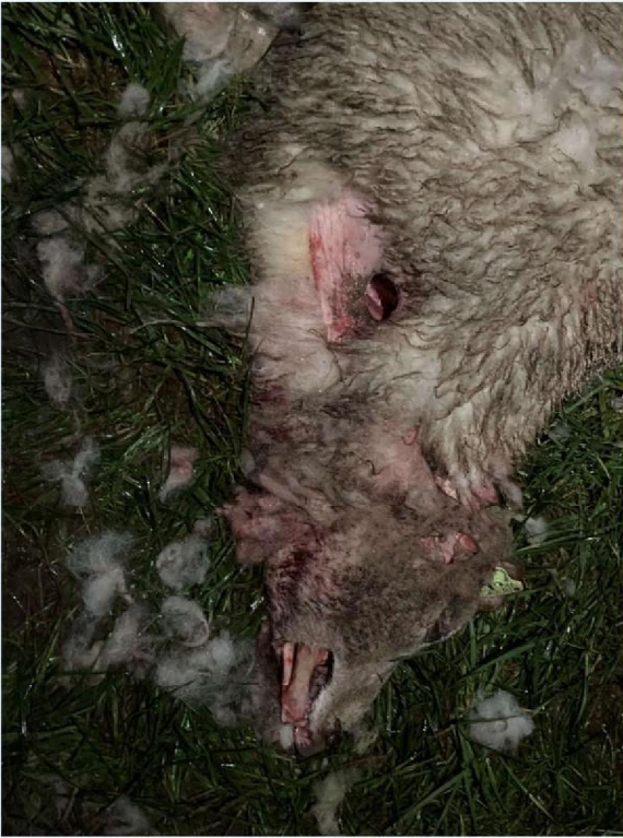
neusbeet schaap 2.JPG