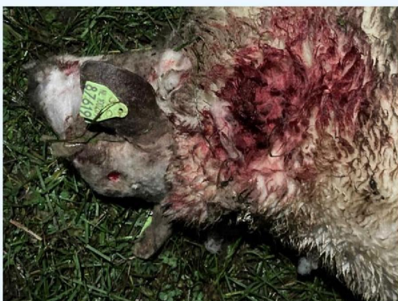
keelbeet 2 schaap 2.JPG