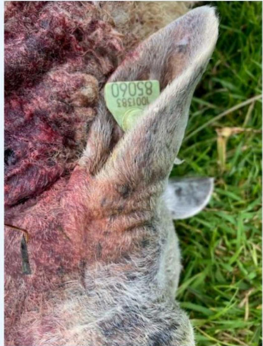
Oornummer schaap 3.jpg