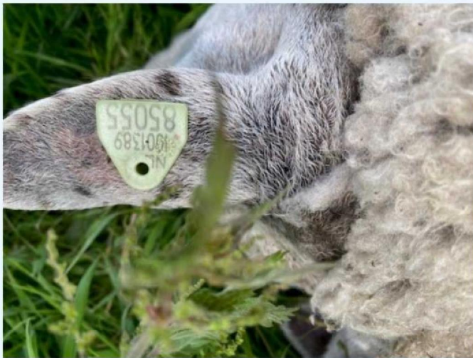
Oornummer schaap 2.jpg