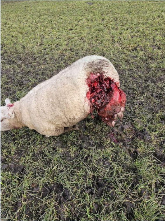
aangepaste foto 22 april 2024.jpg