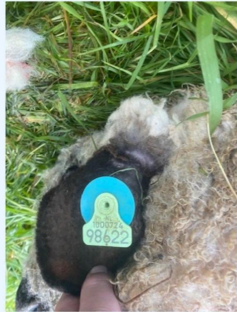
Oornummer gewond schaap.jpg