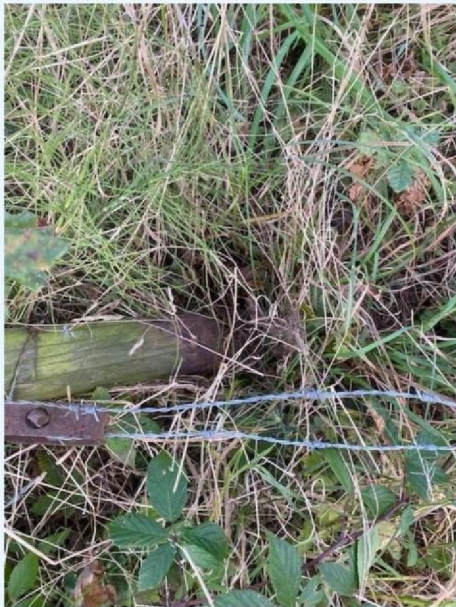
Afgebroken heiningpaal 3.jpg