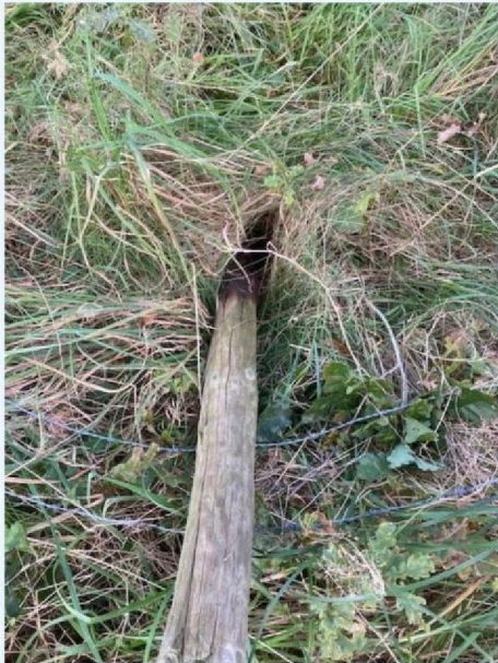
Afgebroken heiningpaal 1.jpg