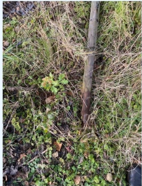
Afgebroken heiningpaal 4.jpg