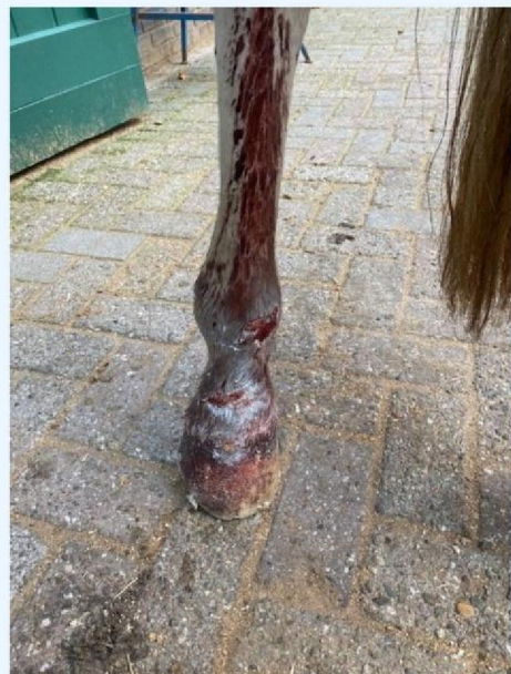
Verwonding rechter onderbeen.jpg