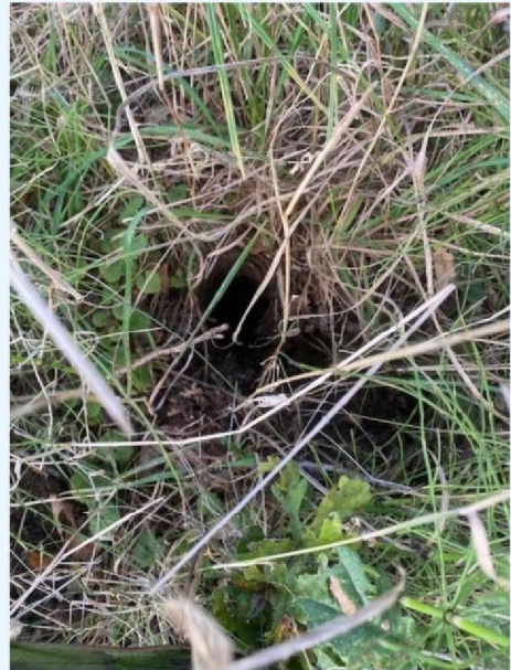
Afgebroken heiningpaal 2.jpg