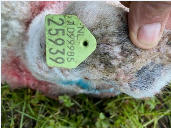
Oornummer schaap 1.jpg