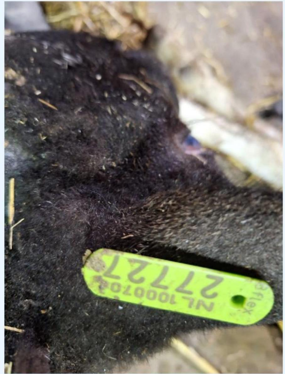
Oornummer schaap wat later is doodgegaan.jpg