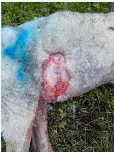
Verwonding schaap 2.jpg