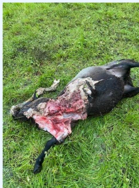
Detail schaap 3.jpg