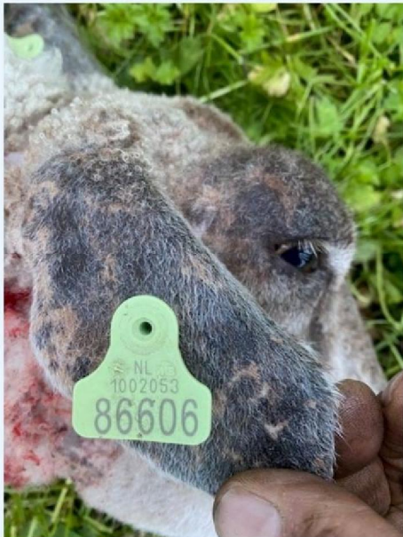
Oornummer schaap 2.jpg