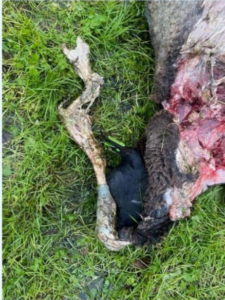
Deel schaap 3.jpg