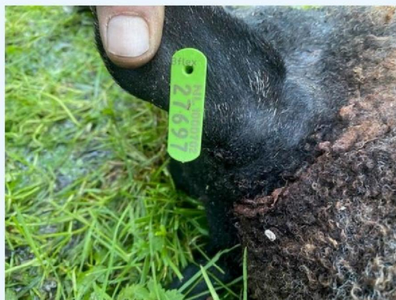
Oornummer schaap 3.jpg