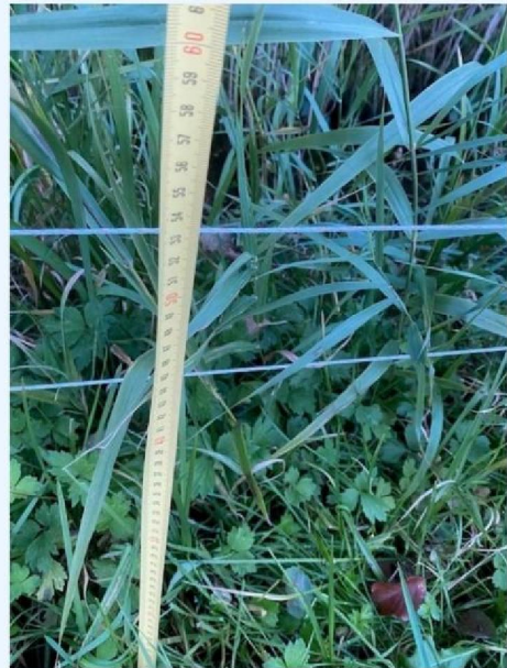
Hoogte andere draden.jpg