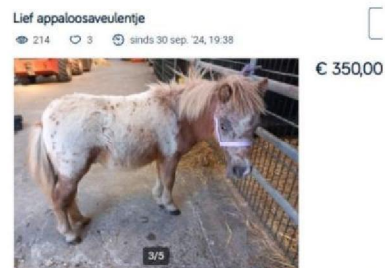
Vraagprijs vergelijkbare dieren.jpg