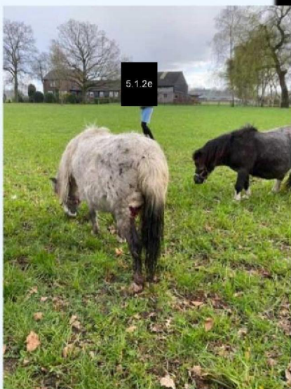
Gewonde Pony 2.jpg