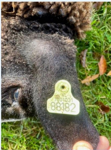
Oornummer schaap 1.jpg