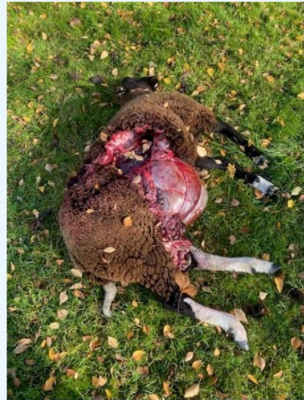
Schaap 1 andere zijde.jpg