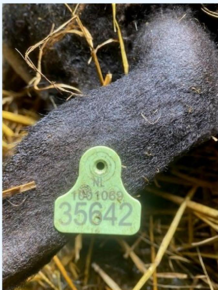
Oornummer schaap 2.jpg