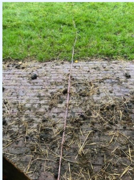
Darm naar buiten gesleept.jpg