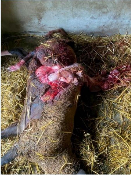
Schaap 2 andere zijde.jpg