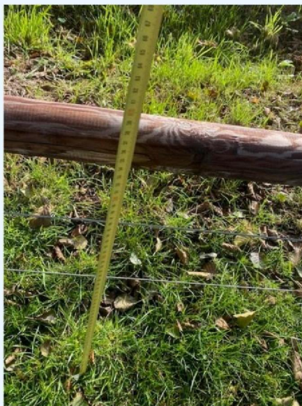
Hoogte onderste draden.jpg