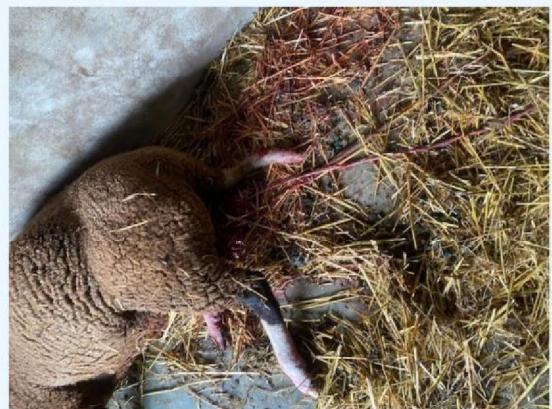
Schaap 2 in de schuilstal.jpg