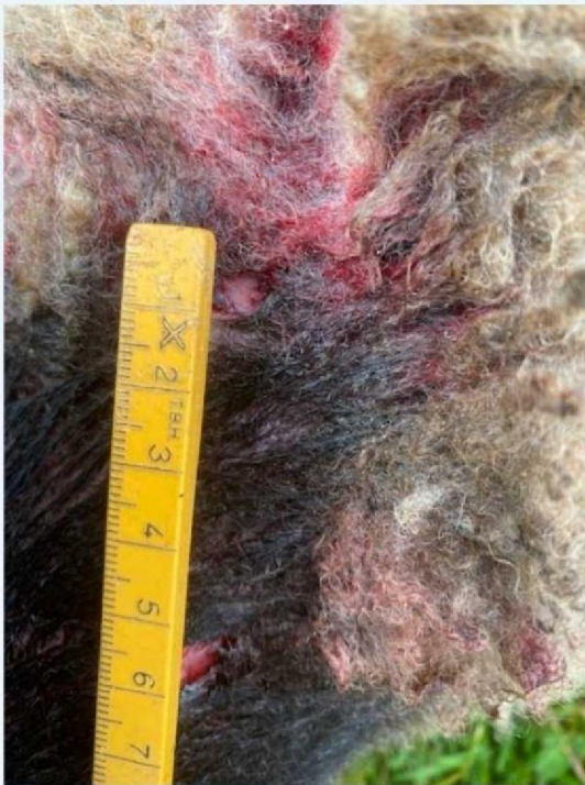
Keelbeet schaap 2.jpg