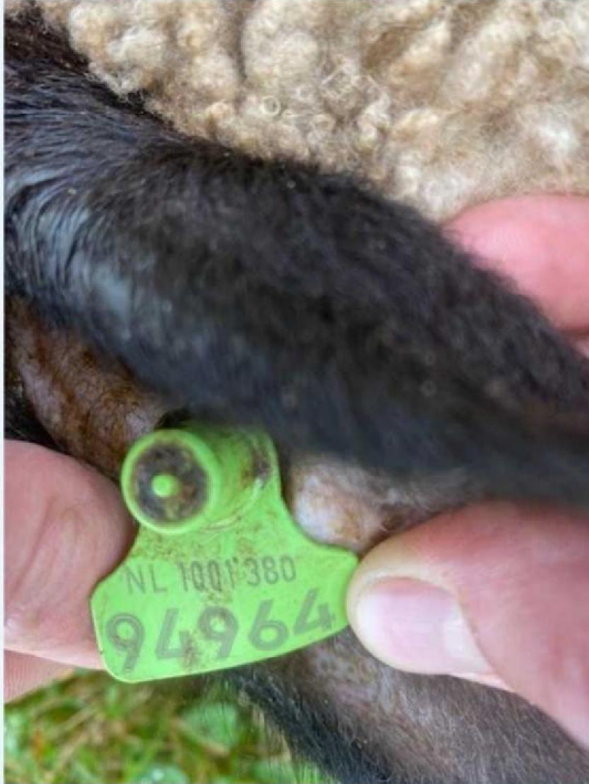
Oornummer schaap 2.jpg