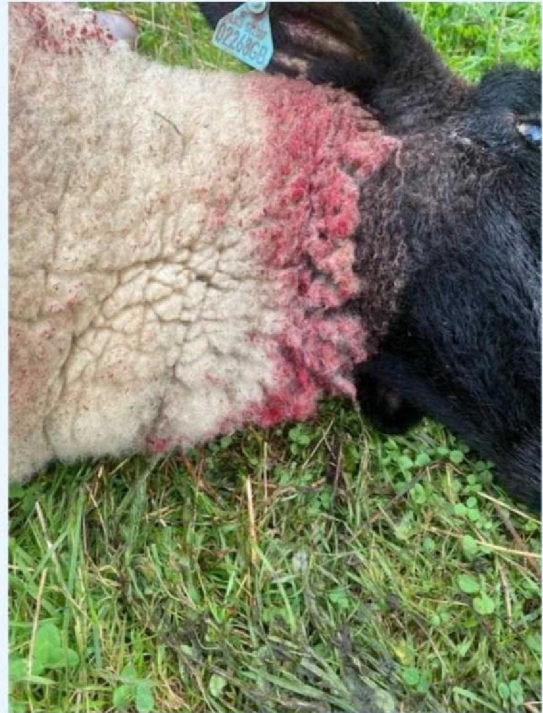
Keelbeet schaap 1.jpg