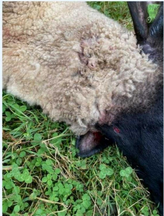
Keel schaap 2.jpg