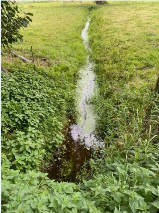
Omheining bij de sloot.jpg