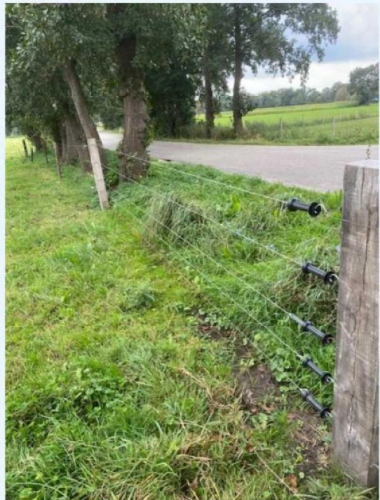
Omheining langs de weg.jpg