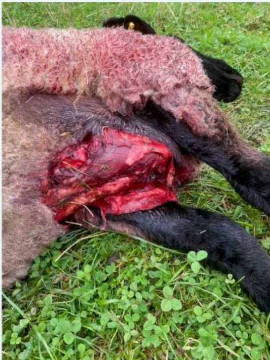
Borst schaap 1.jpg