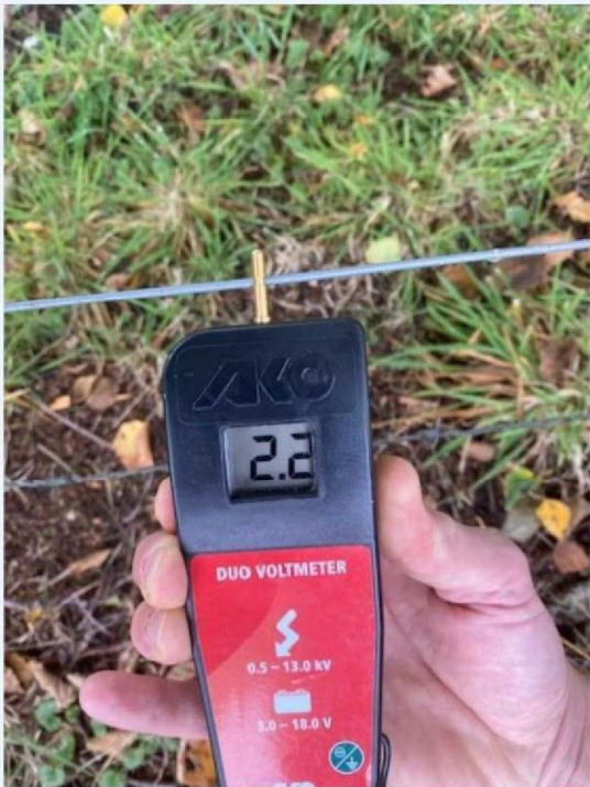
Voltage achterste perceel.jpg