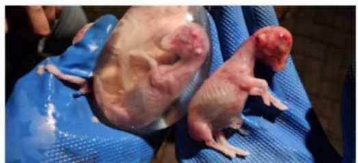
Lamieren die uit ooi 02268 hingen na de aanval.