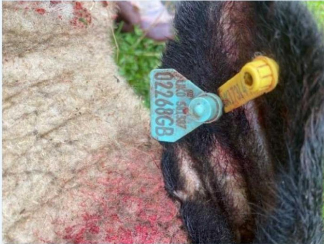
Oornummer schaap 1.jpg