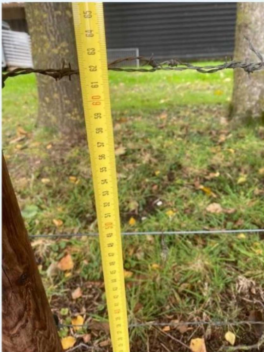
Hoogte draad 2 en 3.jpg