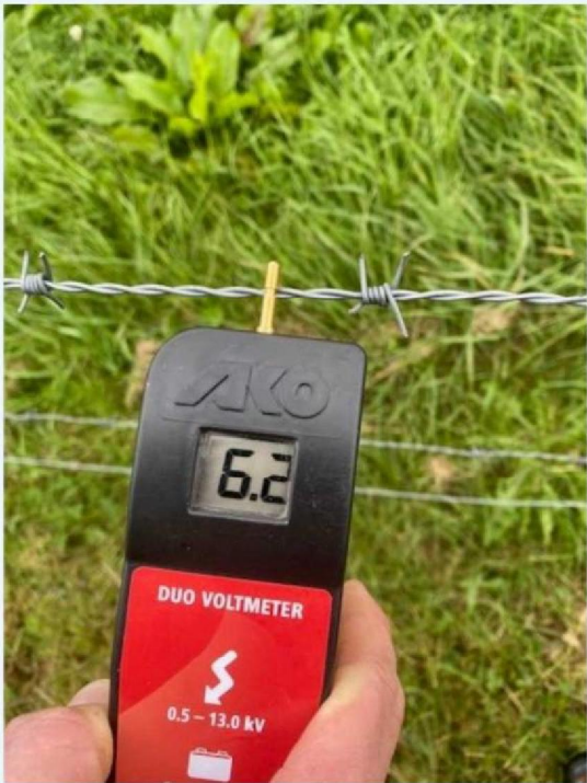
Voltage voorste perceel.jpg