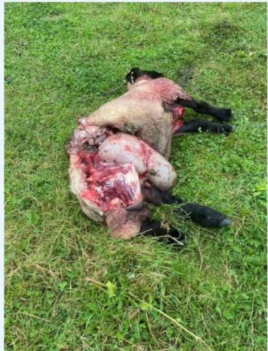
Achterzijde schaap 1.jpg