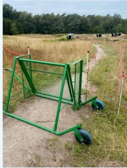
Hek met corridor looppad.jpg