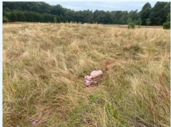
Pens eruit gehaald.jpg