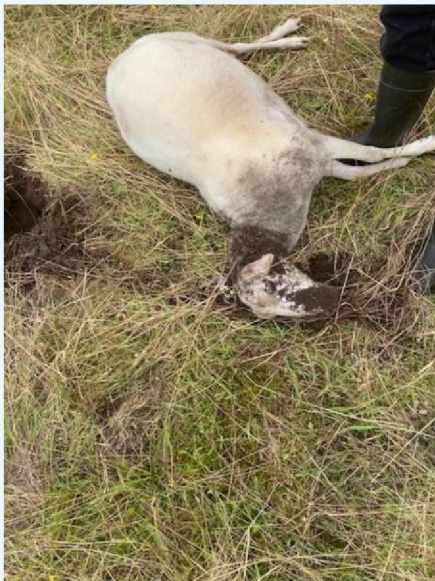
Schaap 5 kop uit het zand.jpg