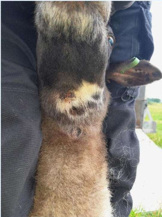
Vermist schaap gevonden, met keelbeet.jpg