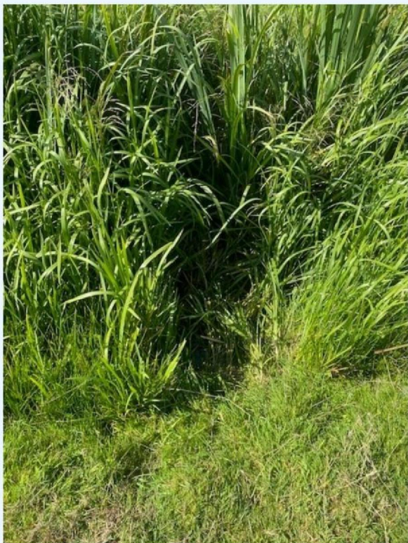
Sleepspoor door sloot.jpg