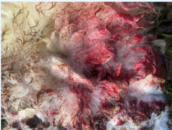
Keelbeet schaap 1.jpg