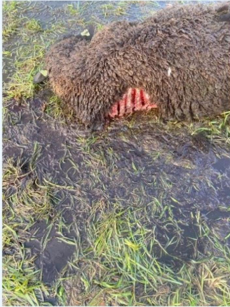
Aangevreten ribben schaap 2.jpg