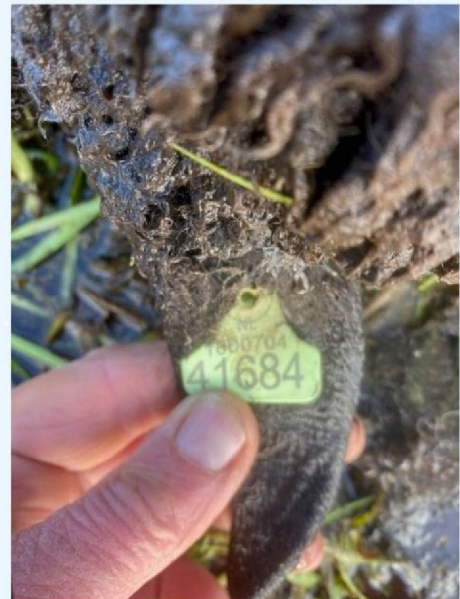
Oornummer schaap 2.jpg