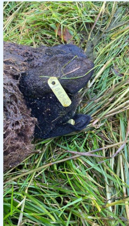
Later dood gegaan schaap.jpg