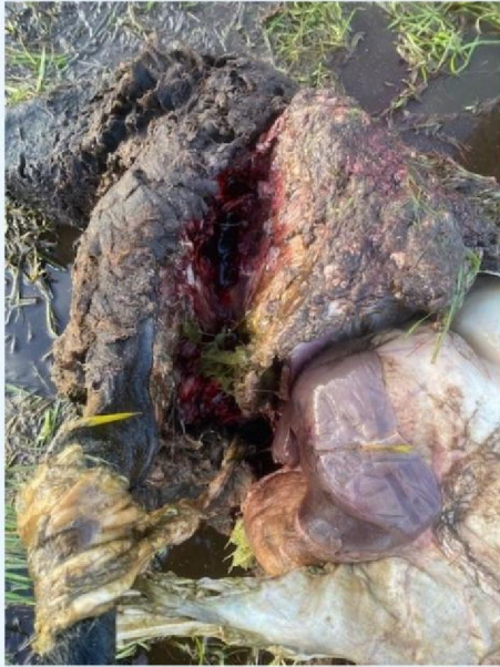
detail schaap 3.jpg