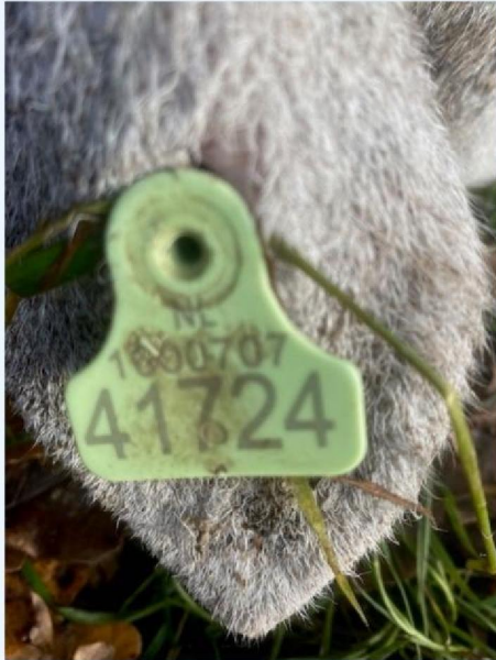
Oornummer schaap 1.jpg