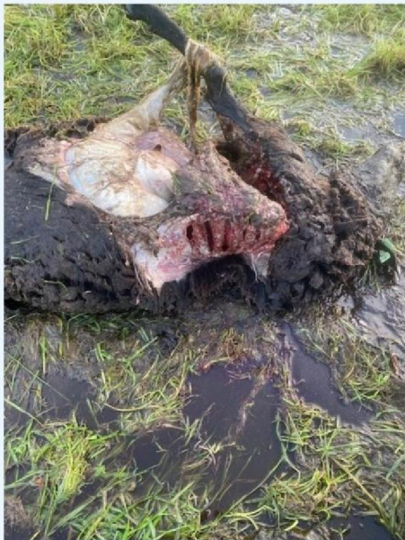
Schaap 3 andere zijde.jpg