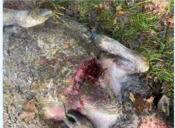
Borstwond schaap 1.jpg