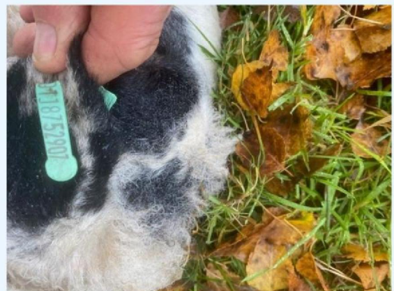
Oornummer schaap 1.jpg