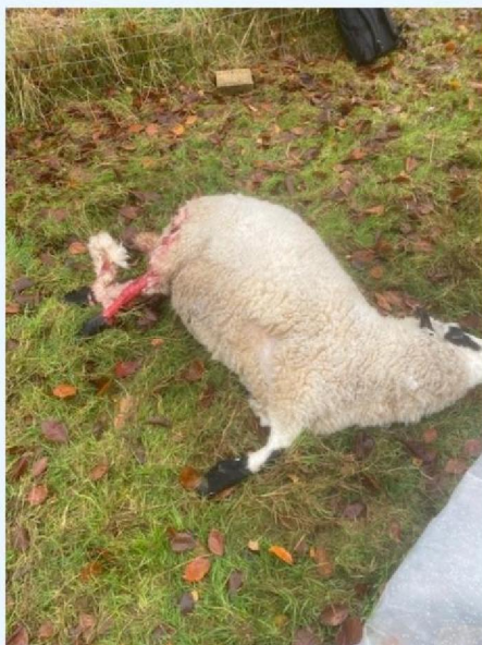
Poot schaap 2.jpg