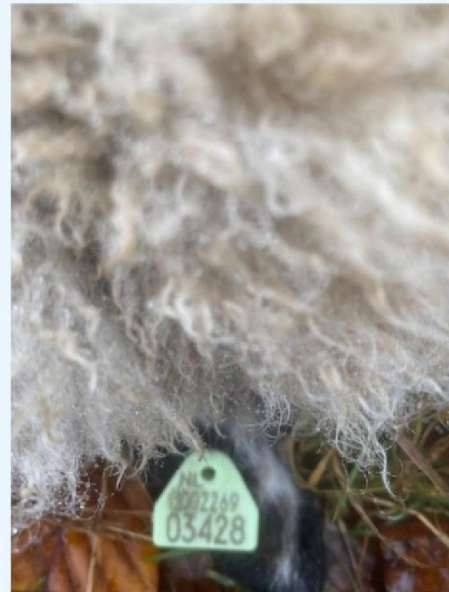
Oornummer schaap 2.jpg