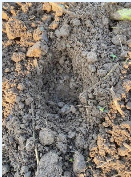
Prent in maisland.jpg