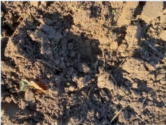
Prent in maisland 2.jpg