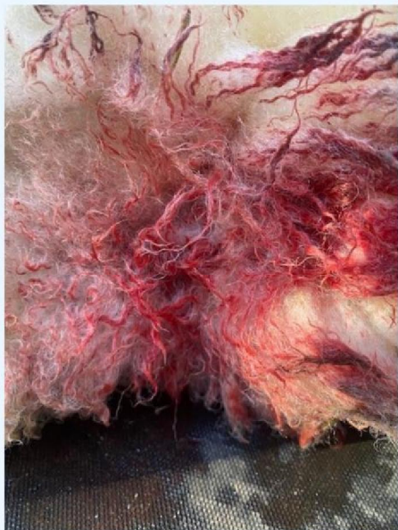
Keelbeet schaap 2.jpg