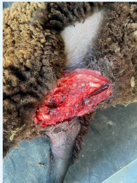
Verwonding schaap 1.jpg