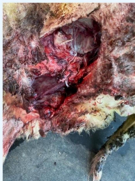
Wond schaap 2.jpg