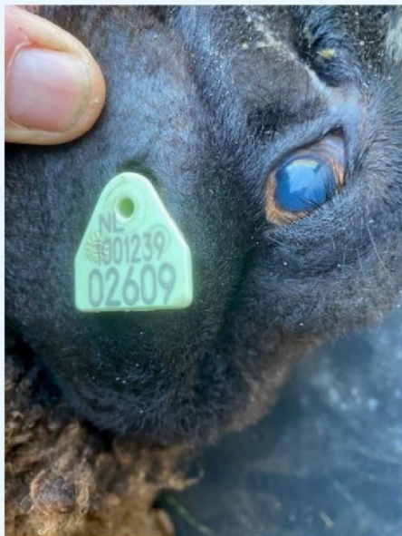
Oornummer schaap 1.jpg