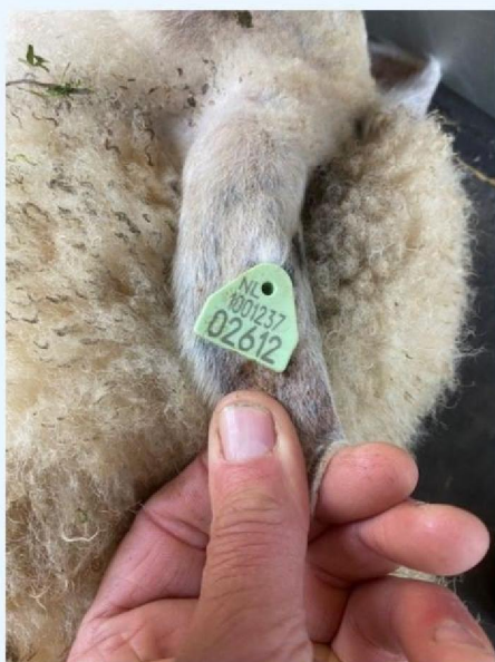
Oornummer schaap 2.jpg