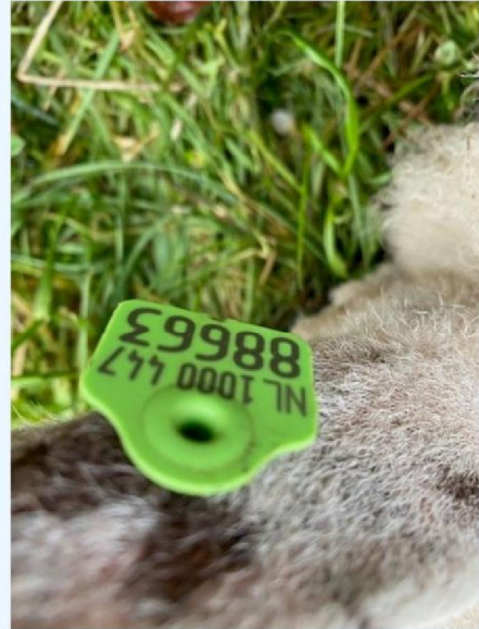
Oornummer schaap 3.jpg