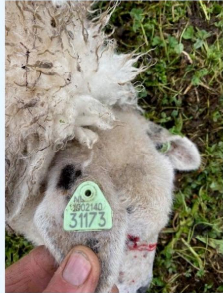
Oornummer schaap 1.jpg