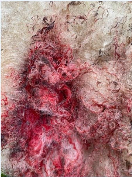
Keelbeet schaap 1.jpg