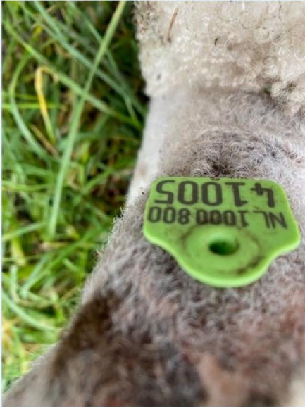
Oornummer schaap 2.jpg