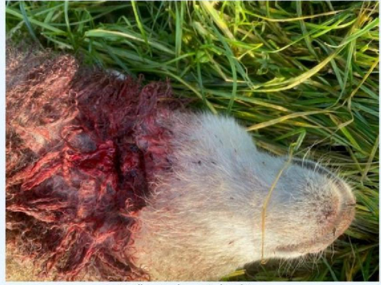
Keelbeet schaap 1 detail.jpg