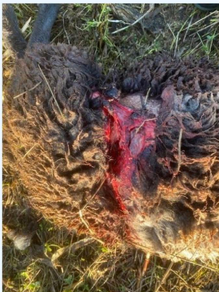
Buikwond schaap 3.jpg