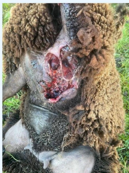
Verwonding schaap 2 afgemaakt.jpg