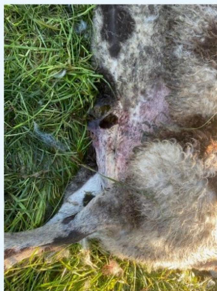
Buikwond schaap 5.jpg