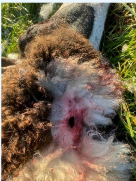
Keelbeet schaap 5 detail.jpg