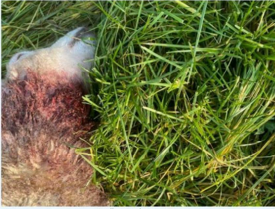
Keelbeet schaap 1.jpg