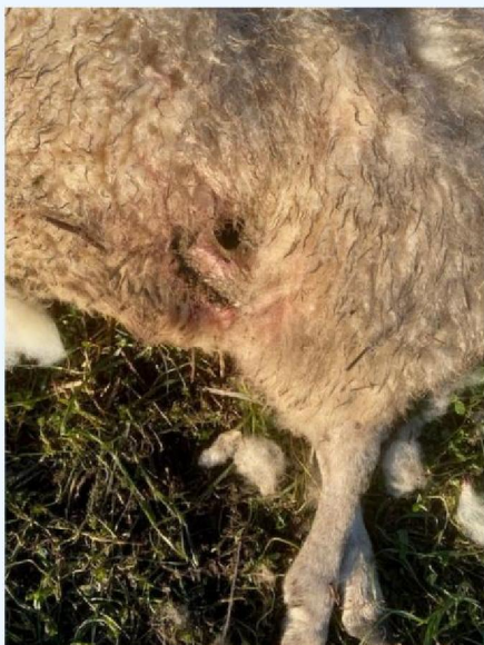
Borstwond schaap 5.jpg