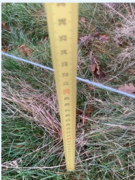
Hoogte draad 1.jpg