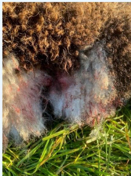
Keelbeet schaap 5.jpg