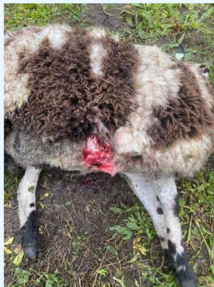
Buikwond schaap 1.jpg