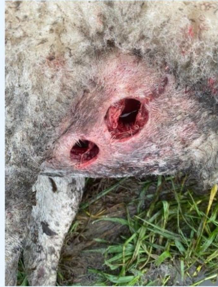
Borstwond schaap 3.jpg