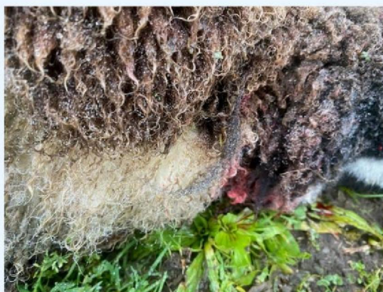
Keelbeet schaap 2.jpg