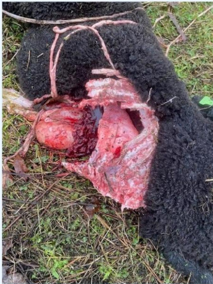
Schaap 6 detail.jpg