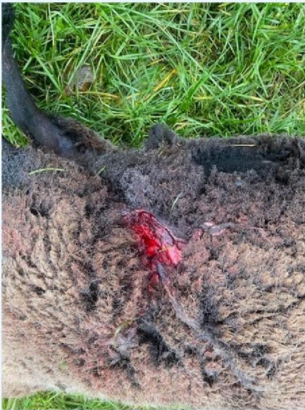
Wond schaap 4.jpg