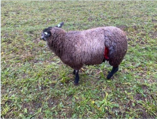
Schaap 10 gewond en later afgemaakt.jpg