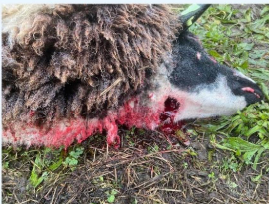
Keelwond schaap 1.jpg