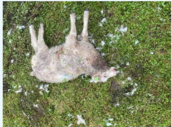
Schaap 9 andere zijde.jpg