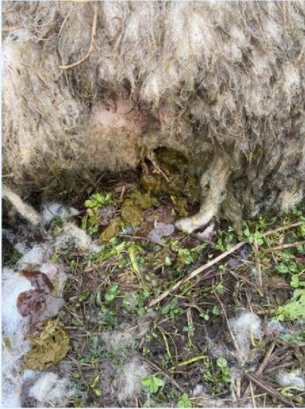
Buikwond schaap 7.jpg