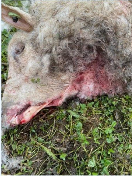
Keelwond schaap 5.jpg