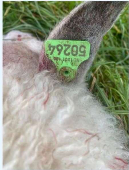
Oornummer schaap 1.jpg