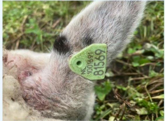
Oornummer schaap 3.jpg