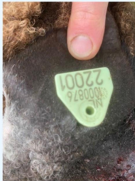
Oornummer schaap 2.jpg