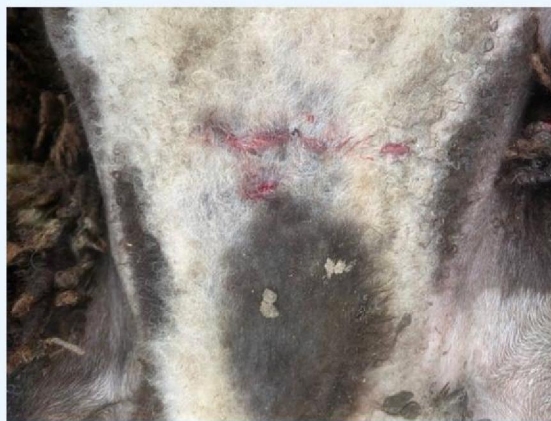
Verwondingen schaap 2.jpg