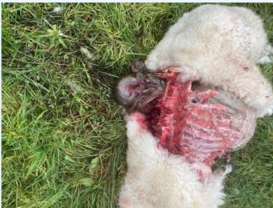
Ribben schaap 1.jpg