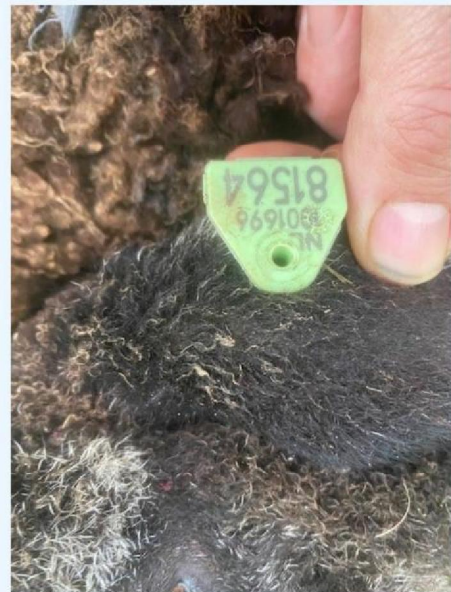
Oornummer schaap 4.jpg