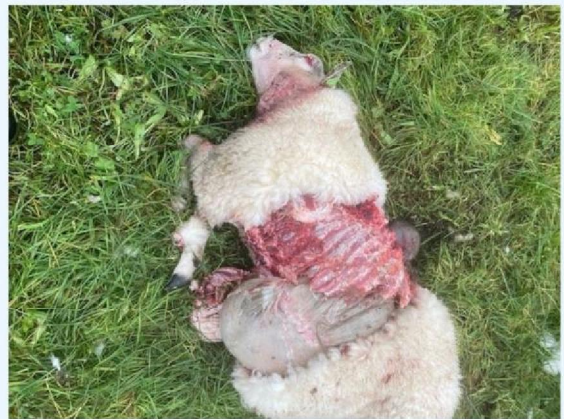
Detail schaap 1.jpg