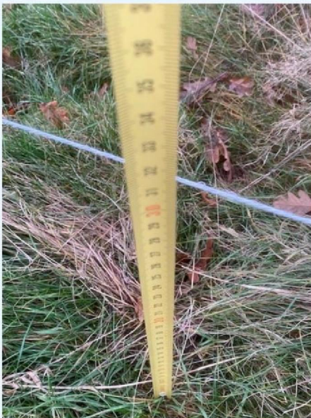
Hoogte draad 1.jpg