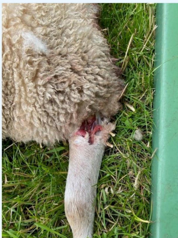
Wond aan de poot.jpg