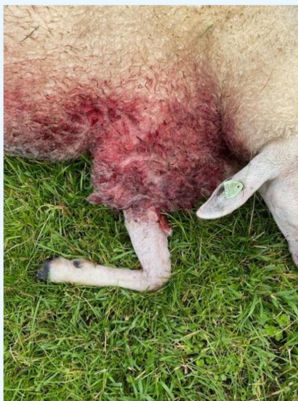
Bloed in de wol.jpg