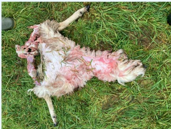
overblijfsel_achterpoten en huid.JPG