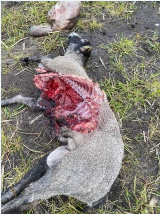
Schaap 3 -2.jpg